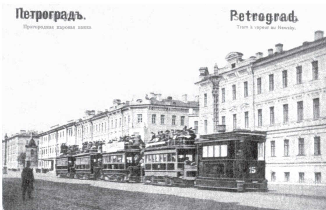
«Пароконка» у домов 174 и 176. Открытка 1914 г.

В 1930-х годах на Старо-Невском были построены первые дома в стиле нарождавшегося в Ленинграде конструктивизма – дома 146 (архитектор И. А. Вакс), 141 (архитектор А. Л. Лишневский), за ним – школьное здание (дом 169, архитектор В. О. Мунц и др.). Появление таких построек было неоднозначно встречено теоретиками ленинградской архитектуры. Некоторые здания при устранении повреждений, полученных в годы Великой Отечественной войны, и при последующих капитальных ремонтах получали упрощенный декор фасадов. Здания столь же простой архитектуры возводились на месте разрушений (дом 175, архитектор Д. С. Гольдгор, дом 184, архитектор А. В. Васильев, 1955). Время конца XX – начала XXI веков ознаменовалось перестройкой зданий, возведенных в середине XIX века, сначала скромно стилизуемых под архитектуру ушедшего времени (дома 99–101), а затем в откровенно современной манере (дома 133–137, архитекторы Е. Л. Герасимов, С. Д. Меркушева, К. В. Смирнов; дом 152).