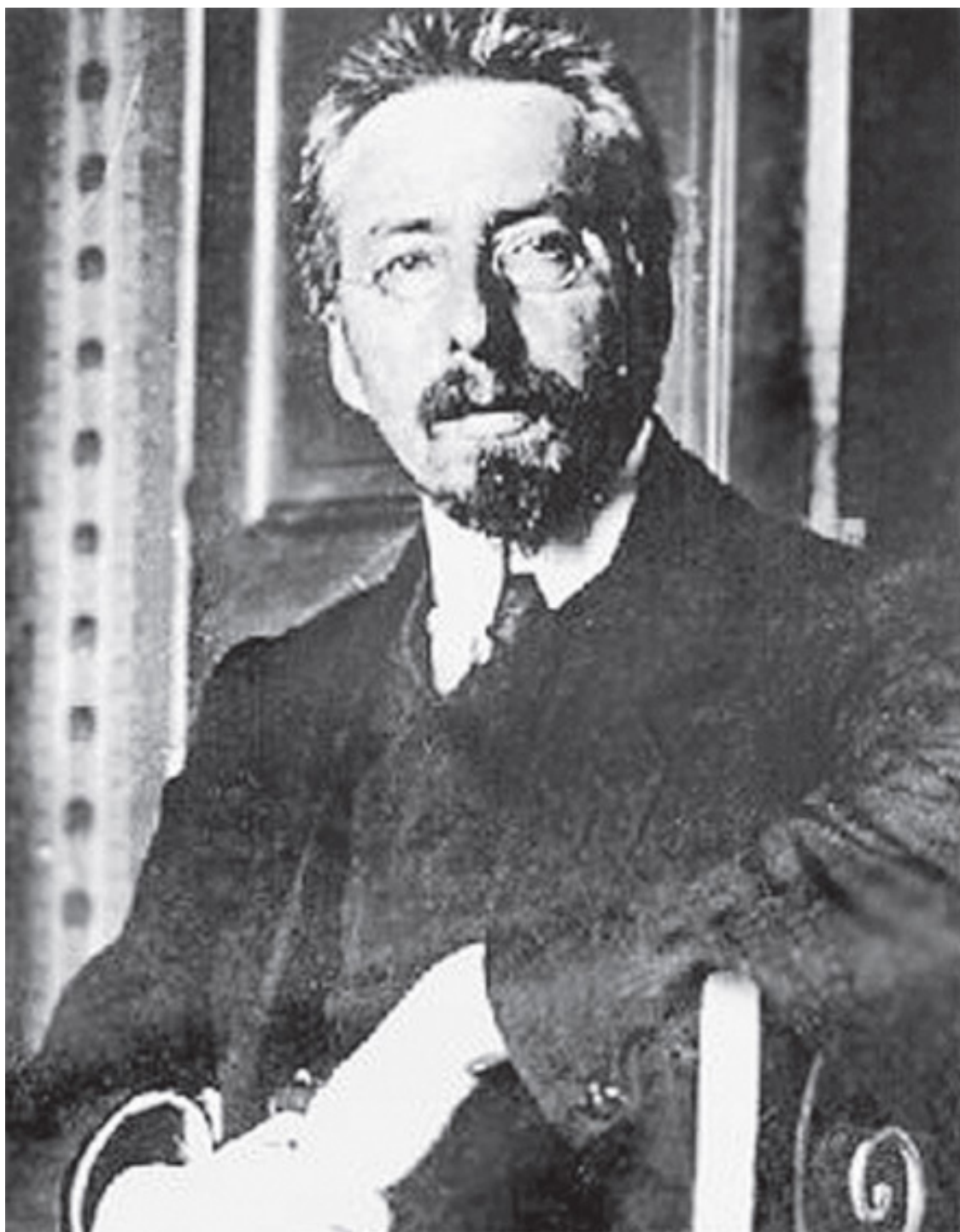
Портрет В. Д. Бурцева

В начале марта 1917 года здесь проходило собрание районных комиссаров Временного правительства. После падения монархии рушились основы старой машины государственного управления. Были упразднены жандармерия и полиция, высший дисциплинарный и уголовные суды, каторга и ссылка, цензура, арестованы царская семья и царские министры, смещена местная администрация (генерал-губернаторы, губернаторы, градоначальники, земские начальники и т. п.), объявлена амнистия «борцам с самодержавием». Власть на местах перешла к назначенным Временным правительством областным, губернским, уездным и городским комиссарам. В Петрограде были назначены комиссары бывших полицейских частей.