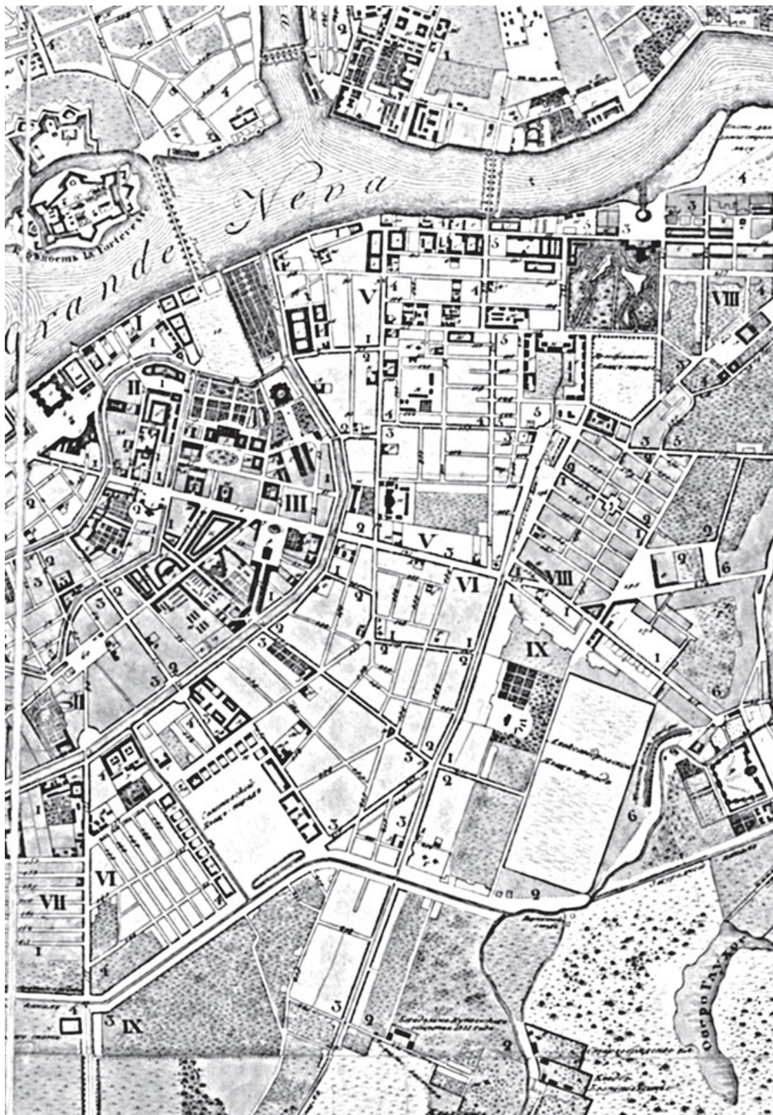
План Санкт-Петербурга, снятый в 1835 г.