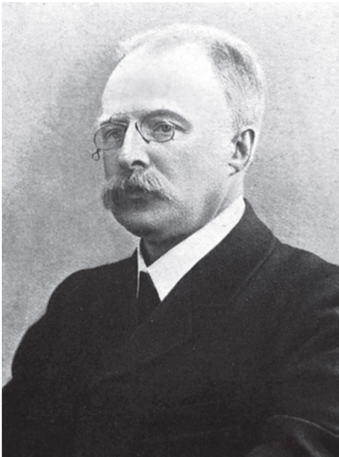
Портрет С. И. Тимашева

Н. С. Тимашев (1886–1970), русско-американский социолог и правовед. Преподавал в Петроградском университете (с 1915 года) и Политехническом институте (1916–1920). С 1921 года в эмиграции преподавал в Русском народном университете в Праге (с 1923 года), Париже (с 1928 года), университетах США (с 1936 года). Труды Н. С. Тимашева по социологии права, истории общественной мысли и социально-политической истории России XX века вновь изданы в России в 1994–2000 годах (журналы «Социологические исследования», «Журнал социологии и социальной антропологии»).