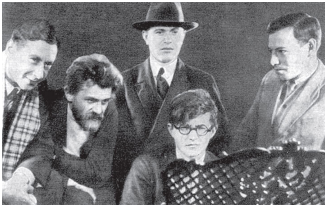
Фотография Л. О. Арнштама (группа)