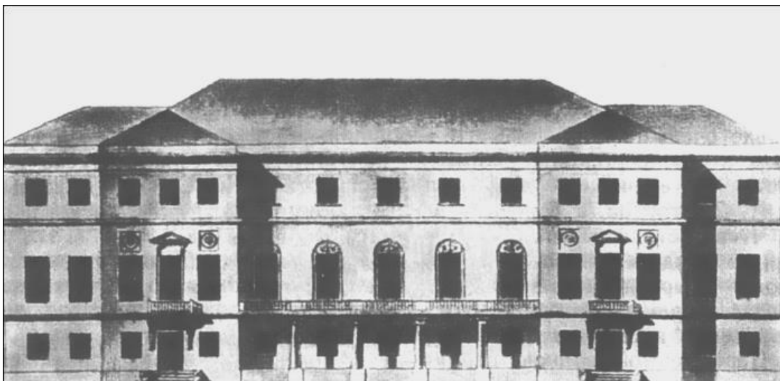
Дом Тютчевых в Армянском переулке в Москве

Места были тихие, спокойные даже в середине двадцатого века, а что уж говорить о начале девятнадцатого?!