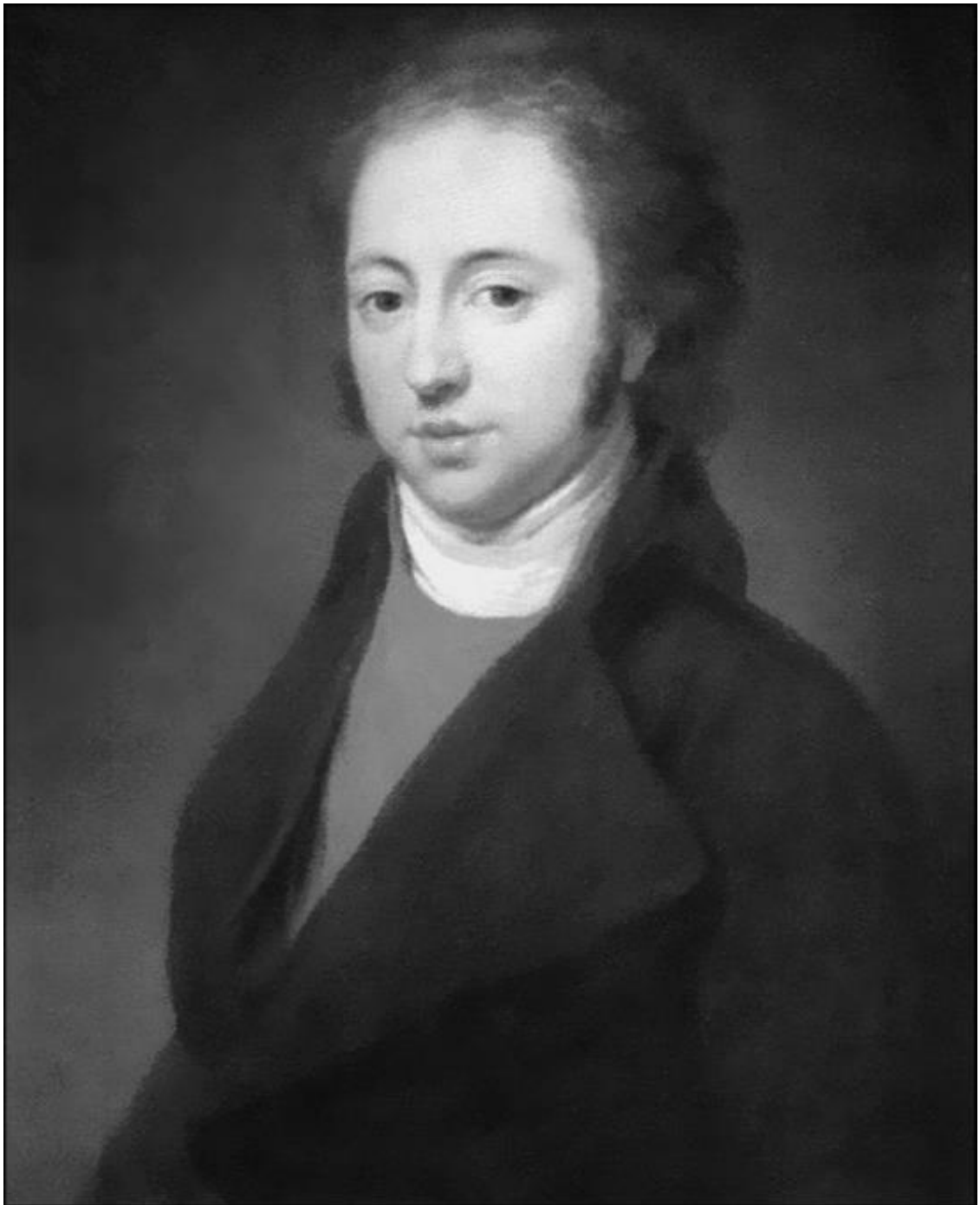
И.Н. Тютчев. Художник Ф. Кюнель

Её начало озарено почти волшебю; роскошный дом имения Овстуг (Брянского уезда, Орловской губернии). Изящный, ласковый мальчик, очень одаренный, баловень матери. В доме смесь духа православного с французскими влияниями. – Так и всегда было в барстве русском. Говорили в семье по-французски, а у себя в комнате Екатерина Львовна, мать поэта (урожденная графиня Толстая), читала церковно-славянские часословы, молитвенники, псалтыри. «Юный принц» возрастал привольно. Учился, но нельзя сказать, чтобы умучивался трудом – навсегда осталось широкое, вольготное отношение к работе».