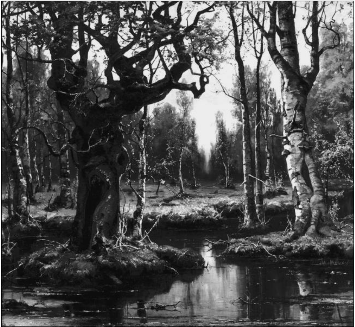
Осень. Художник Ю.Ю. Клевер