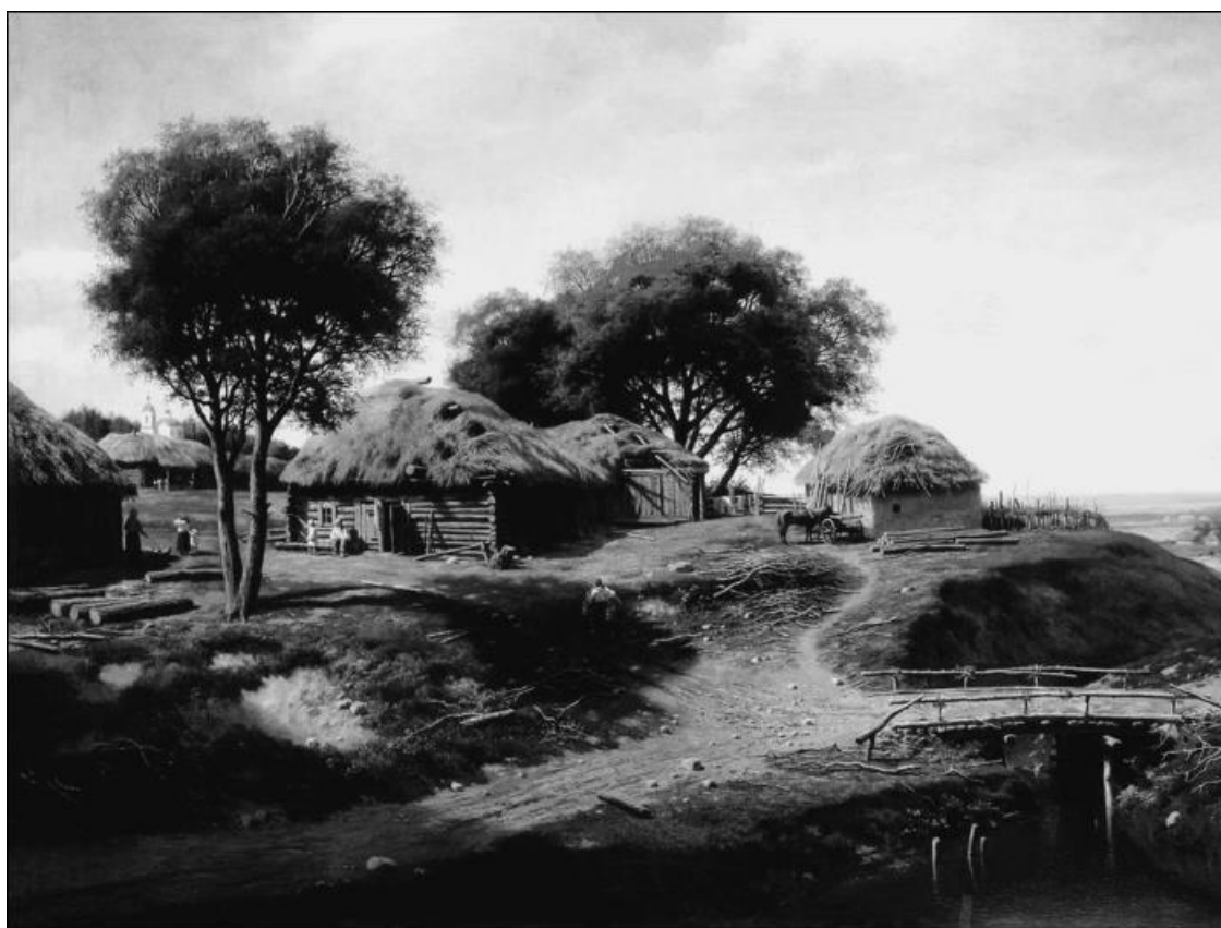
Село в Орловской губернии. Художник М.К. Клодт

Эти слова приведены автором статьи «Орел. Город на века» (Источник: Орловское информбюро).