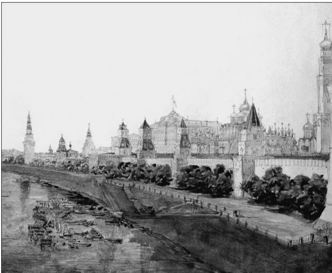
Москва. Вид на Кремль с Москворецкого моста. Художник В.С. Садовников

Ну а о связях, которые не оканчивались браками, мы и говорить не станем. Так что же это? В советские времена за подобное поведение вызвали бы на партком и пропесочили по первое число, обвинив в распущенности. Но при Тютчеве парткомов не было. Однако в царской России было общество, зачастую, мягко говоря, неважное, существовало и определённое общественное мнение... Общество не простило Тютчеву его внебрачные отношения с Еленой Денисьевой, ну а то, что на такое пошёл величайший поэт России, вызывало лишь ещё больший гнев и ещё более дерзкие на него нападки.