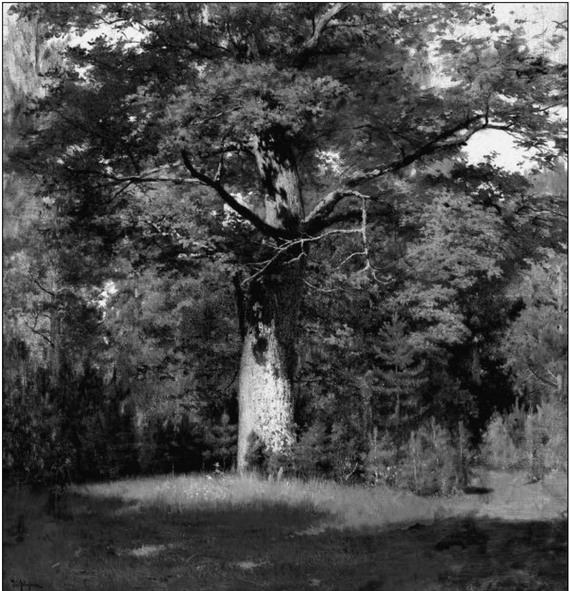
Дуб. Художник И.И. Левитан