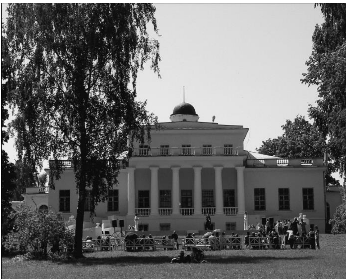
Дом усадьбы Овстуг, воссозданный в 1986 г. по проекту В.Н. Городкова

Орловская губерния... В ту пору Овстуг входил в Брянский уезд Орловской губернии. Лишь в 1920 году Брянск стал губернским городом, но ненадолго, ибо в 1930 году его включили в состав Западной области, и лишь 5 июля 1944 года была образована Брянская область. И с тех пор Овстуг уже как бы и не на Орловщине находится. Это уточнение важно, поскольку обычно можно услышать, что Тютчев уроженец Орловской губернии, а музей его находится в Брянской области, в Овстуге.