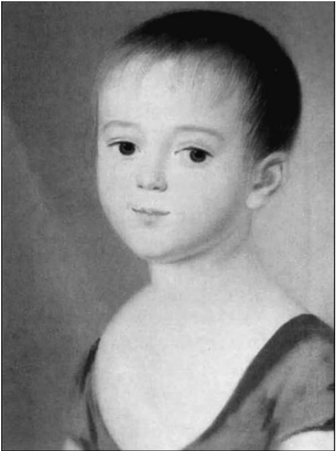
Ф.И. Тютчев в детстве. Неизвестный художник

И нельзя не обратить внимания на то, сколь легко он оперирует именами из греческой мифологии... ведь упомянутый Крон (Хронос) – бог времени, Вавилон – столица Вавилонского царства (IX–VI вв. до н. э.), а Мемфис – столица Древнего Египта, находившаяся южнее современного Каира, и Илион, малоизвестное второе название Трои. «Илиада» Гомера названа именно по Илиону... Так говорится в комментариях к стихотворению.