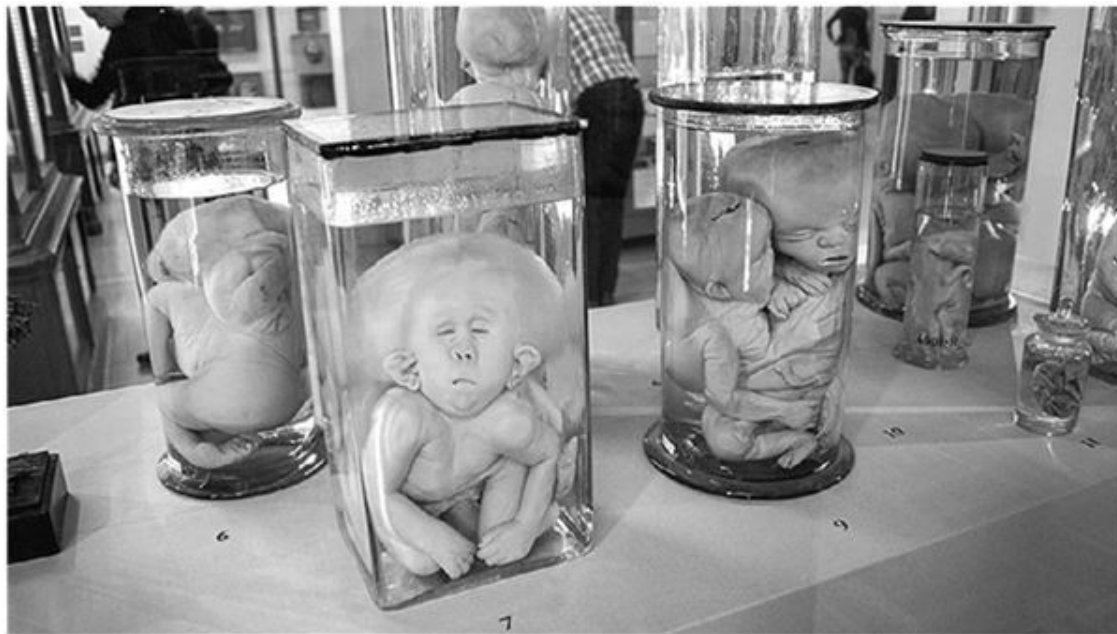
«Уродцы» Петра I в Кунсткамере, Петербург

Из полезных диковинок, имеющих благое влияние на дела государственные, упомяну бот, найденный Пётром Алексеевичем в годы юности его на нашем льняном дворе и называемый «дедушкой русского флота», ибо от хождения на ботике сем по измайловским прудам у государя превеликая охота к корабельному делу появилась.