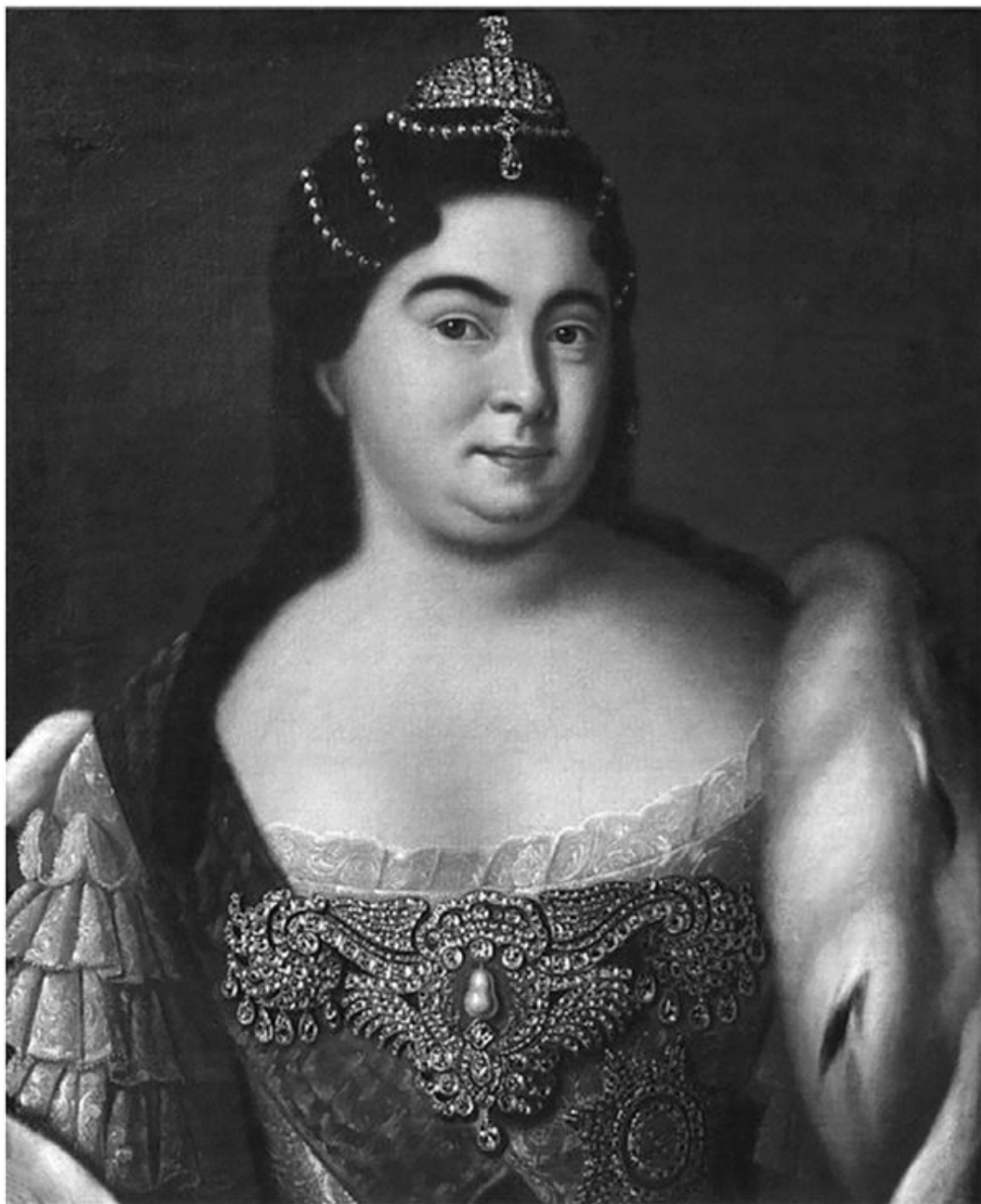
Портрет Екатерины I. Неизвестный художник начала XVIII века

– Ох, ты, Господи! – сказал он. – Никак государыня Екатерина Алексеевна, а с ней Вилий Монс! Ишь ты, под ручку идут, и он ей чего-то на ухо нашептывает! Дойдёт до государя, быть беде!