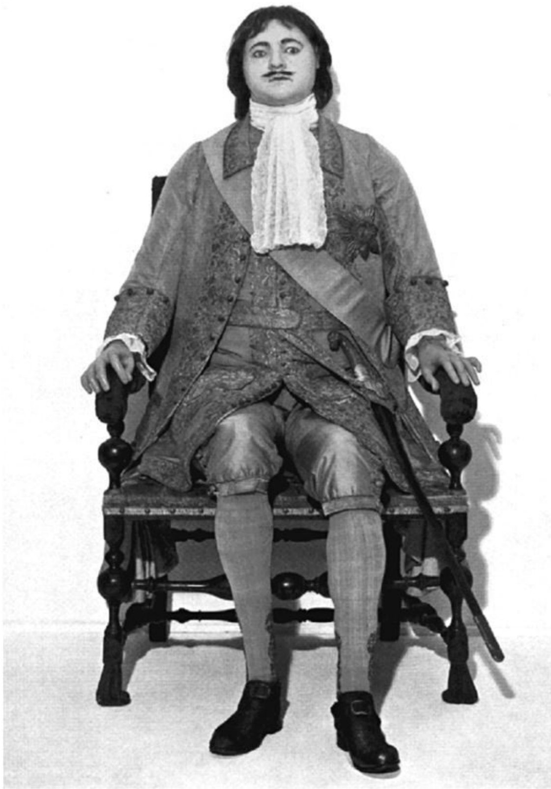
«Восковая персона» Петра I работы Б. Растрелли. Лицо сделано с посмертной маски Петра

В одежде государь был столь же неразборчив, как в домашней бытности: одевал, что ни попадя и как попало. Я уже рассказывал, как увидав его в первый раз, принял за убогого, в дальнейшем же убедился, что полное пренебрежение к нарядам для него обычным делом было. Не токмо перед своими, но и перед иностранными гостями и посланниками появлялся