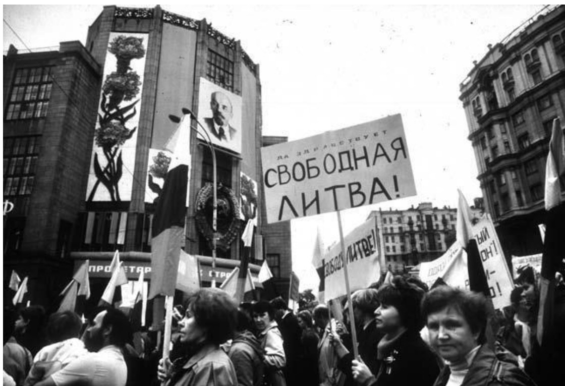
Первомайская демонстрация 1990 года на улице Горького. СССР пока нерушим, но республики уже требуют свободу.