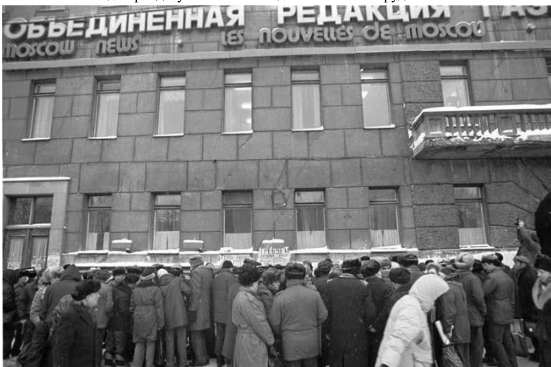
Один из стихийных диспутов у стен редакции газеты „Московские новости“ на Пушкинской. Свобода слова

Вдруг разрешили открывать кооперативы, а было это серьезным отступлением от завоеваний пролетарской революции 1917 года, ведь нас учили: частная собственность – основа жестокой и бесчеловечной эксплуатации человека человеком. Теперь частную собственность узаконили. Первый кооператив – ресторан «Кропоткинская, 36» – в американском Белом доме называли «капитализм на Кропоткинской».