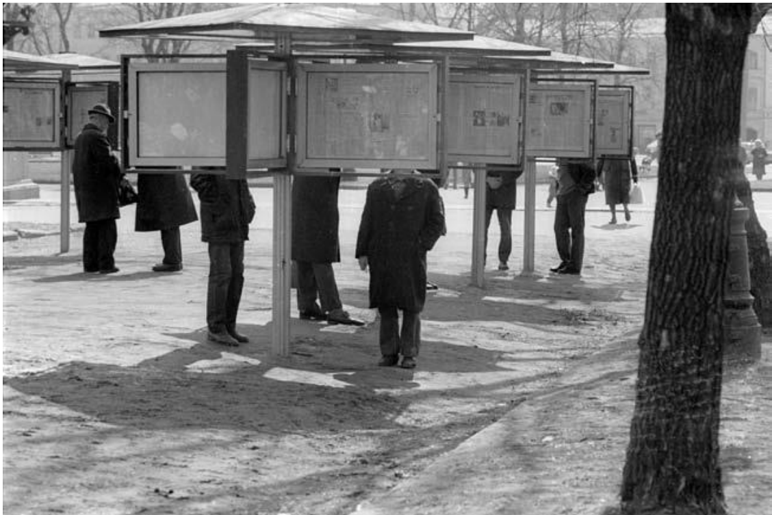
Гласность: жажда правды у газетных стендов на Чистых прудах