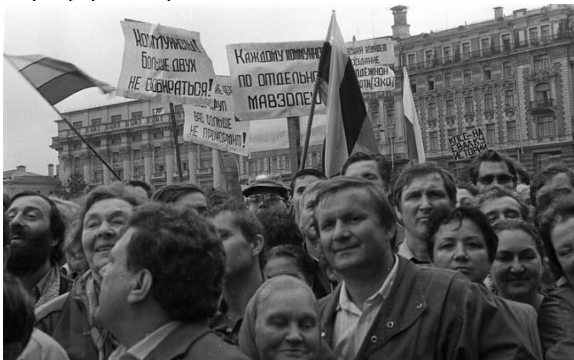
Митинг на площади 50-летия Октября (в 1990 году переименована в Манежную). КПСС – на свалку истории!