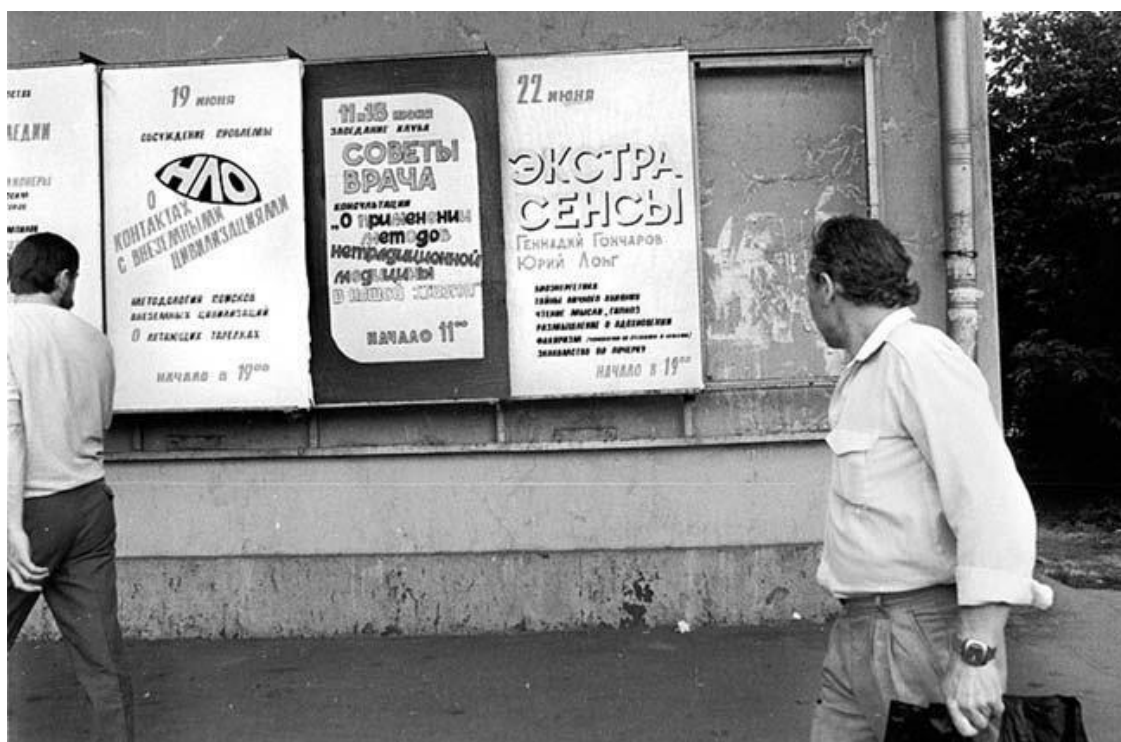
Афиши на стенде ДК Зуева на Лесной улице – Экстрасенсы и инопланетяне...