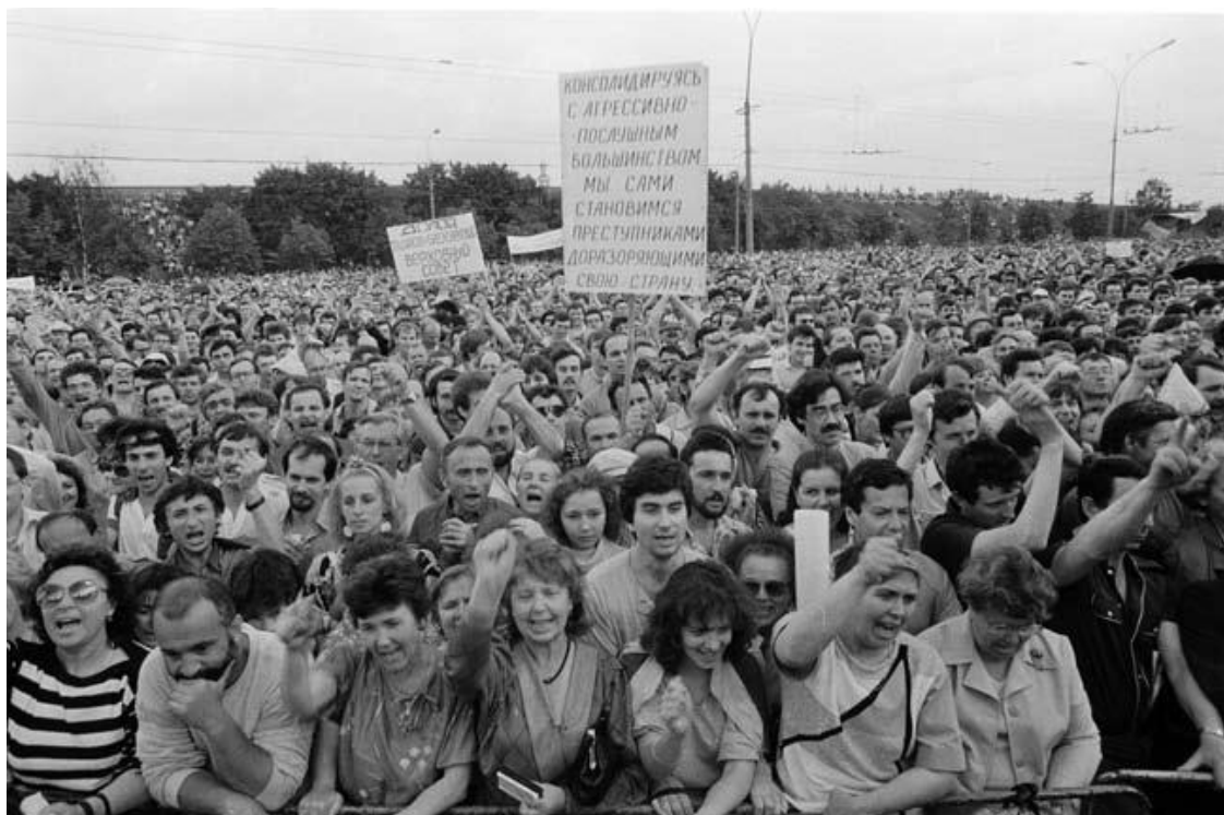
„Перемен требуют наши сердца!“ Митинг в Лужниках, лето 1989