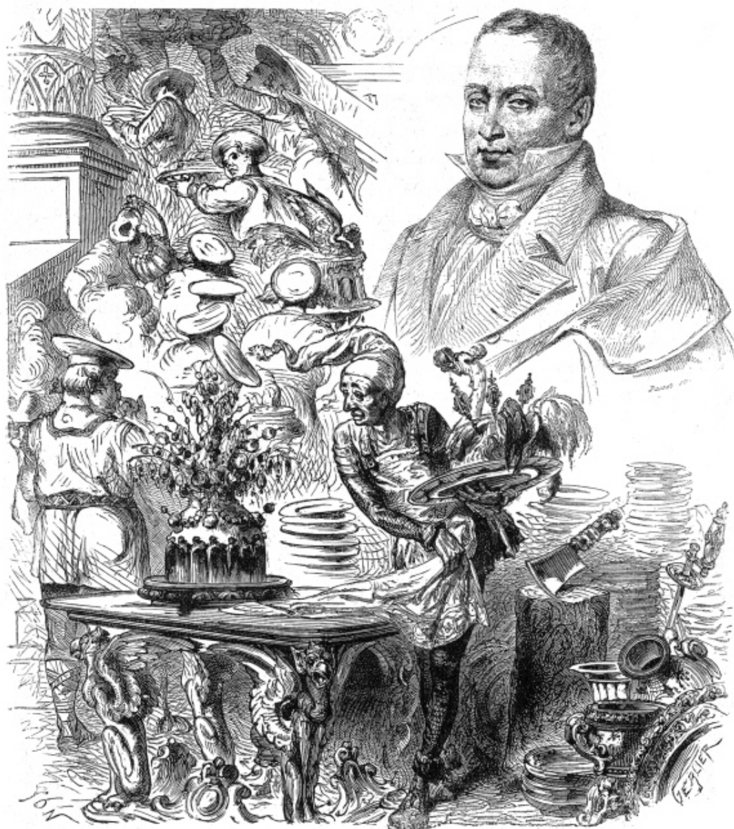
Гюстав Жерлье. Жан Антельм Брийя-Саварен. Иллюстрация из «Большого кулинарного словаря» Александра Дюма