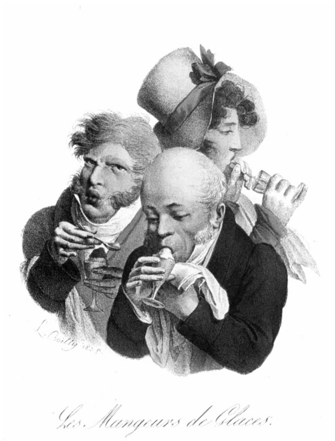
Мороженое. Литография Байи. 1835

Приятные же ощущения, наоборот, пробегают лишь по короткой лесенке с малым количеством ступеней, и если еще имеется достаточно ощутимая разница между совершенно безвкусным и тем, что все-таки тешит вкус, то промежуток между признанно хорошим и превосходным не слишком велик; это разъясняется следующим примером: первая ступень – жесткое и лишенное соков вареное мясо; вторая ступень – кусок телятины; третья ступень – приготовленный как надо фазан.