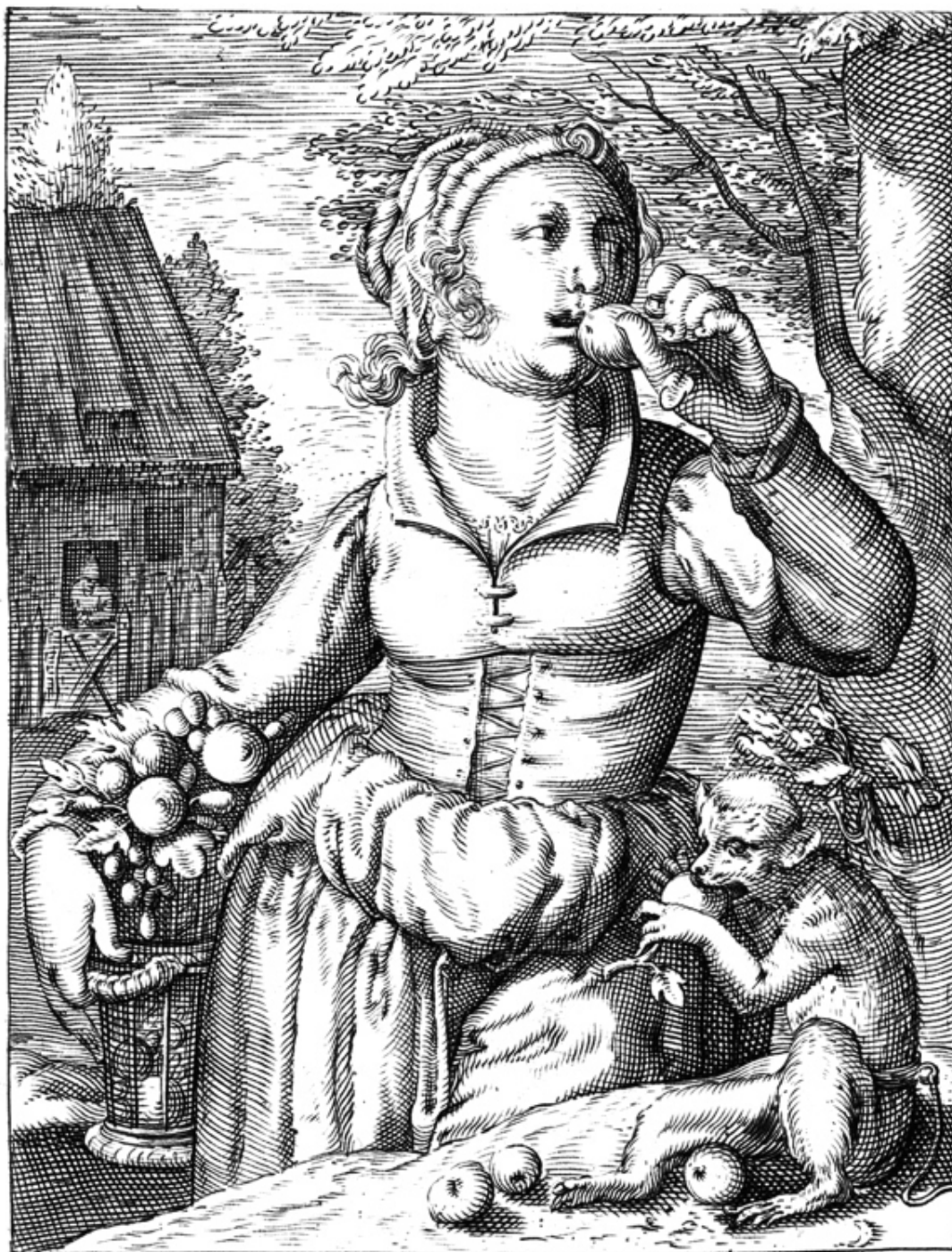
Хендрик Хондиус. Вкус. Аллегорическая гравюра из серии «Пять чувств». XVII в.

Щеки выделяют слюну, равно необходимую для жевания и формирования так называемого пищевого комка 27 ; они так же, как и нёбо, отчасти наделены оценивающими способностями. Право же, я не знаю, участвуют ли в этом при некоторых обстоятельствах еще и десны, однако без ощущения запаха, сосредоточенного в нашем зеве, вкус оказался бы притупленным и в высшей степени неполным.