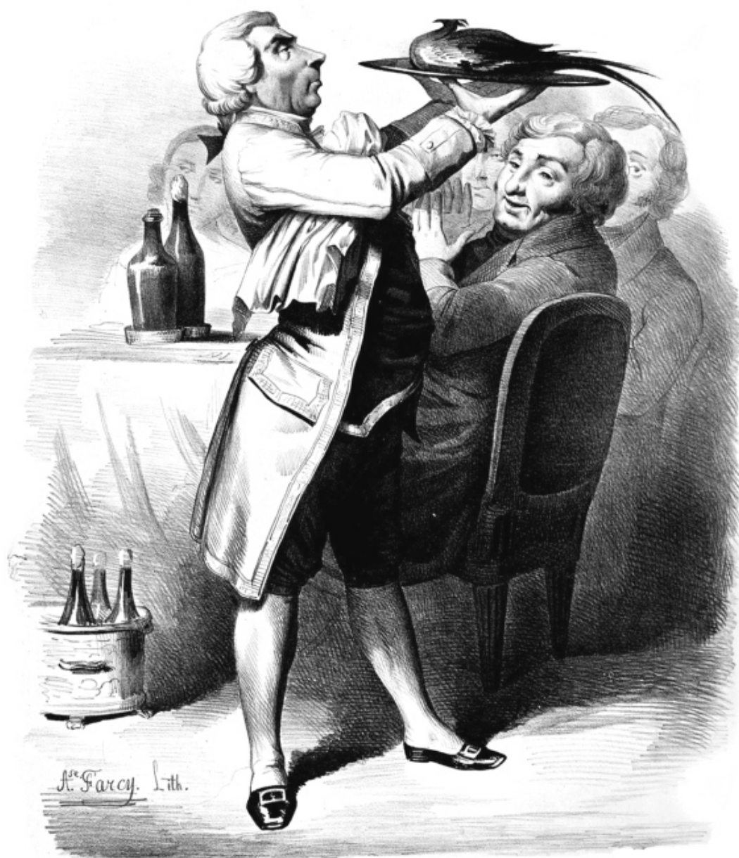
Иллюстрация к «Физиологии вкуса» из парижского издания 1847 года