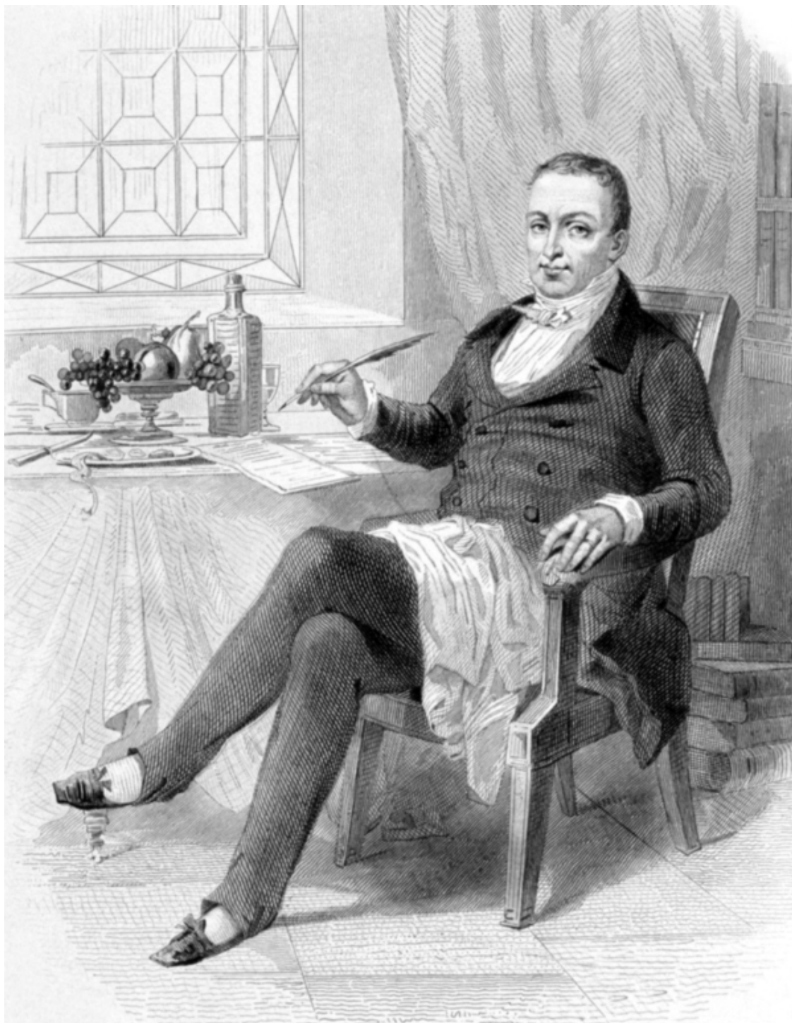
Шарль-Мишель Жофруа. Жан Антельм Брийя-Саварен. Литография. 1848