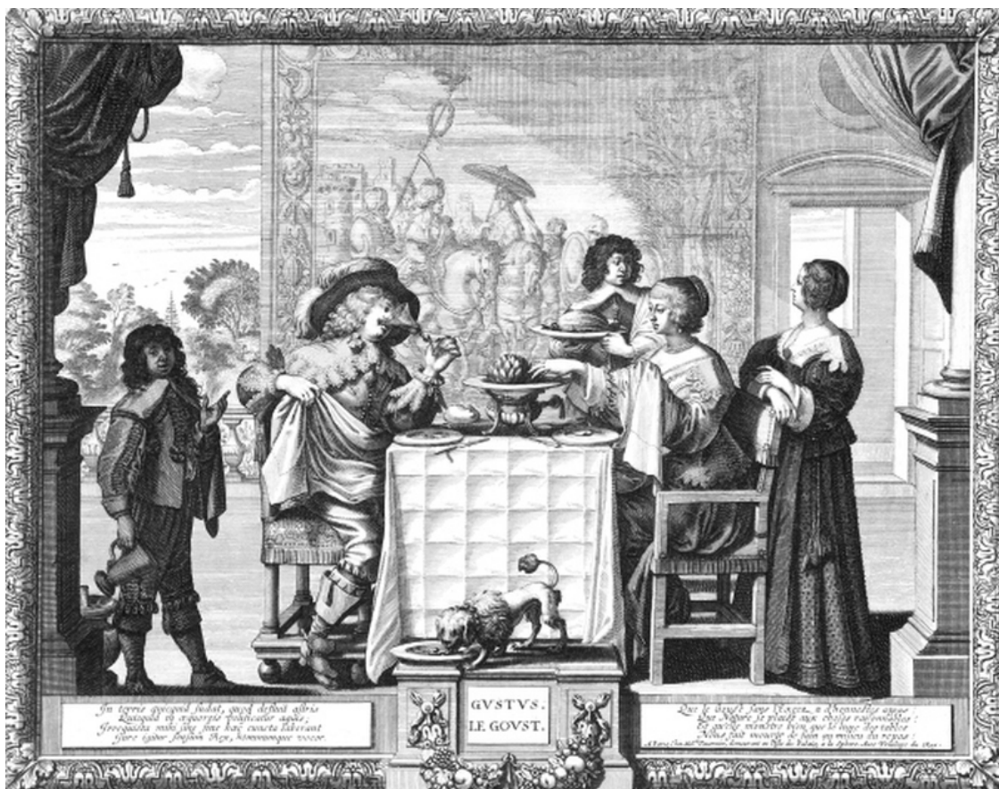
Абрахам Босс. Аллегория вкуса. Гравюра из серии «Пять чувств». 1635–1638

Так что отведем половому влечению должное место среди чувств, в коем ему невозможно отказать, а заботу определить его ранг возложим на наших потомков.