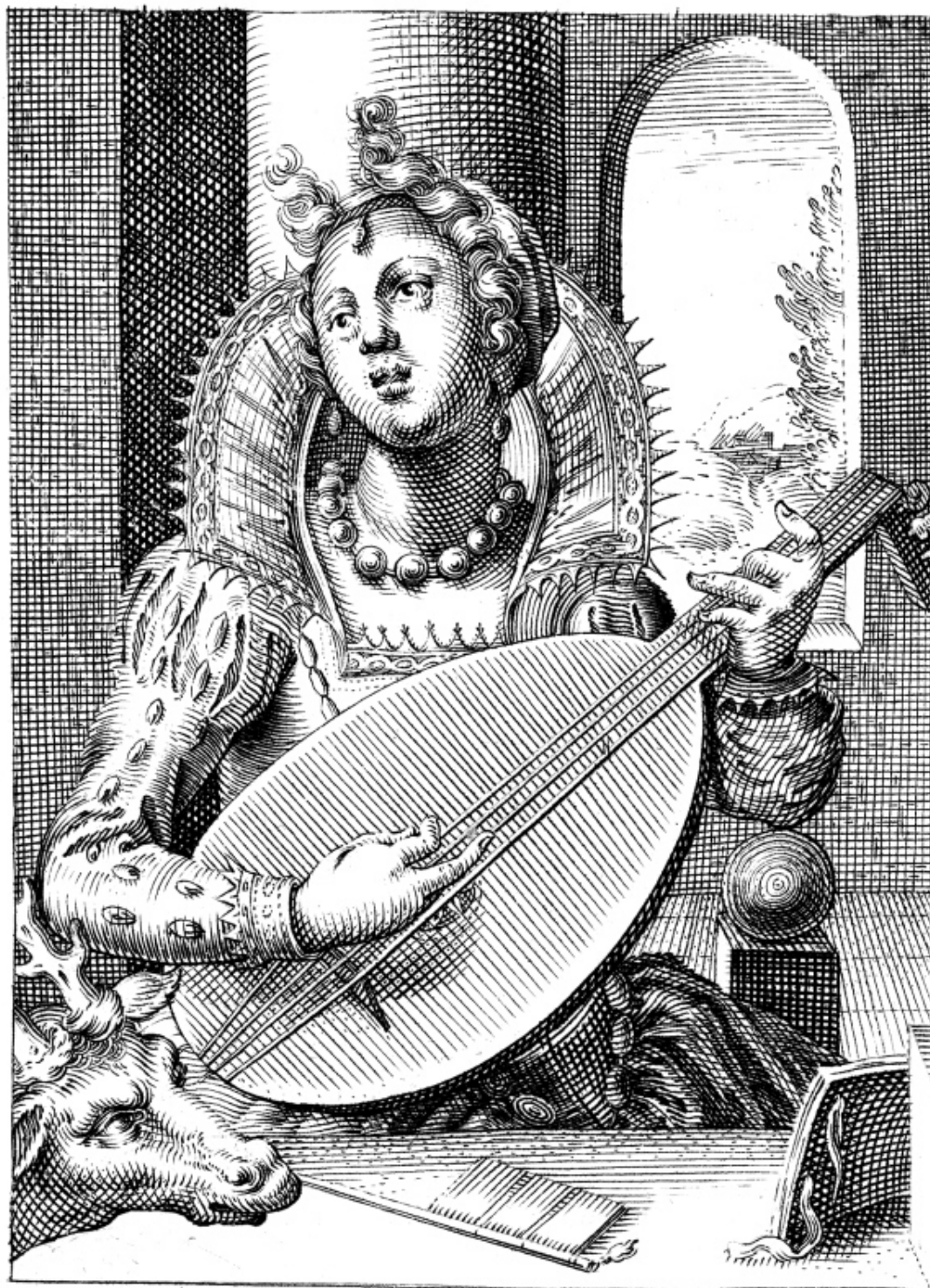
Хендрик Хондиус Старший. Слух. Аллегорическая гравюра из серии «Пять чувств». XVII в.

Что же касается тех, для кого музыка всего лишь хаотичное нагромождение звуков, то уместно заметить, что фальшиво поют почти все; надо полагать, что слуховой аппарат у них устроен таким образом, что воспринимает только короткие вибрации без волнообразных колебаний, или, скорее, поскольку оба их уха обладают разными диапазонами, то из-за разницы в длине вибраций и слабой чувствительности их слуха они передают в мозг лишь смутное,