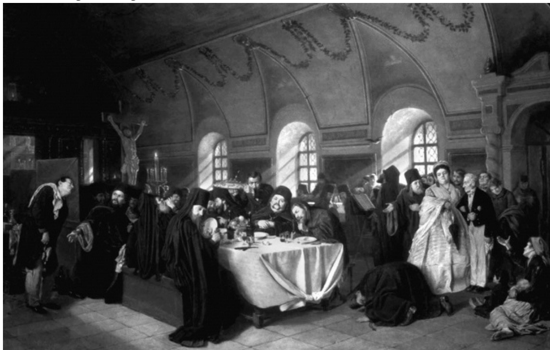
В. Перов «Монастырская трапеза»

Русское православие, которому русский народ обязан своим нравственным воспитанием, не ставило слишком высоких нравственных задач личности среднего русского человека, в нем была огромная нравственная снисходительность. Русскому человеку было прежде всего предъявлено требование смирения. В награду за добродетель смирения ему все давалось и все разрешалось. Смирение и было единственной формой дисциплины личности. Лучше смиренно грешить, чем гордо совершенствоваться.