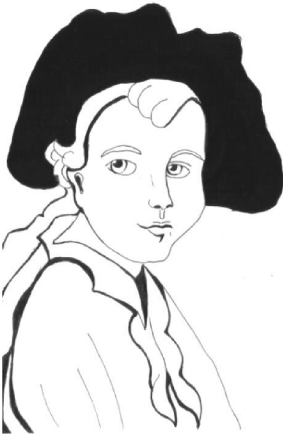
Рис. 1. Саша Суворов

В конце концов отцу пришлось уступить. 3 ноября 1742г. Саша был зачислен мушкетером в лейб-гвардии Семеновский полк. Это была его первая победа. И в последующем Суворов всегда будет победителем, возможно, именно потому, что всегда будет верен своей мечте и своей совести. В 1748 г. он приезжает в полк и начинает действительную военную службу. Дворян тогда записывали в гвардейские полки раньше, а по-настоящему они начинали служить с 18 лет и то не все, некоторые так и не начинали, а Саша нес действительную военную службу.