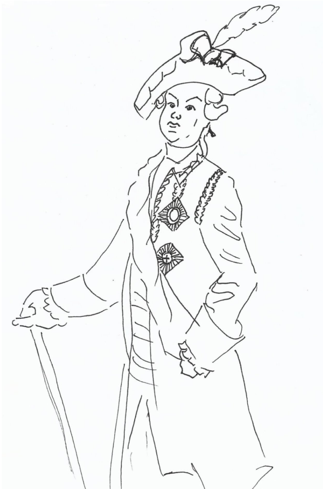
Рис. 4. П. А. Румянцев

Вместе с генералом Вейсманом (позже погибшем в бою) Александр Васильевич снискал себе славу лучшего поискового генерала, сказывался его наступательный настрой и полупар-