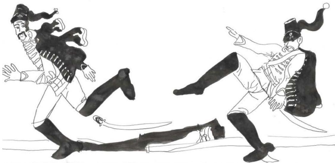
Рис. 3. Прусские гусары

А пока молодой Суворов командует небольшими отрядами пехоты и кавалерии, совершая дерзкие решительные вылазки на пруссаков, которые неизменно заканчиваются его победой.