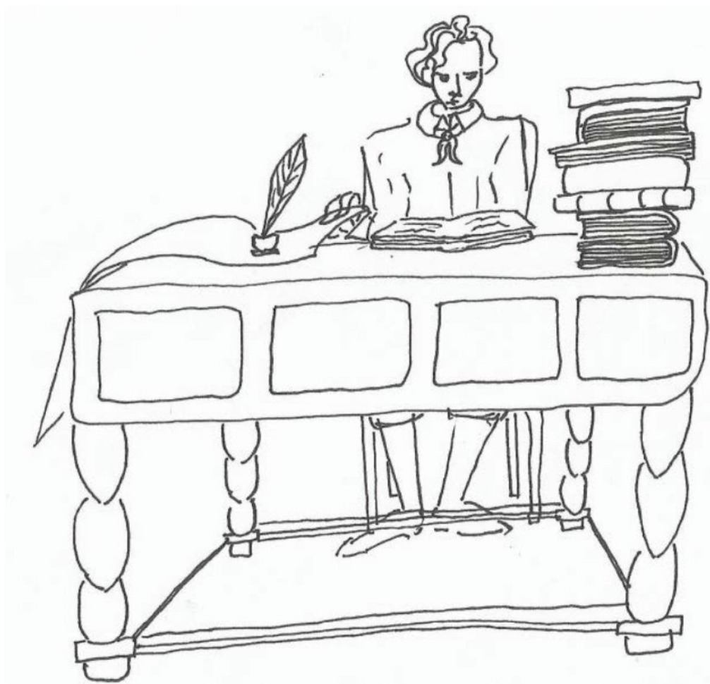
Рис. 2. Суворов читает книги

Действительную значит настоящую. Ходил во все наряды и караулы, а не нанимал вместо себя простых солдат, как это делали другие дворяне. Жил Саша не в казарме, а на квартире, и не потому что не хотел, а просто потому, что казарм тогда вообще не было, они появились позже с воцарением любителя прусских порядков – императора Павла I. В свободное время он зачитывался литературой, кстати сказать, не только военной, но также философской и художественной. Книги он покупал на деньги, которые отец давал ему на еду. Вольным слушателем посещал лекции Шляхетского кадетского корпуса, заглядывал в литературные кружки, пробовал писать стихи.