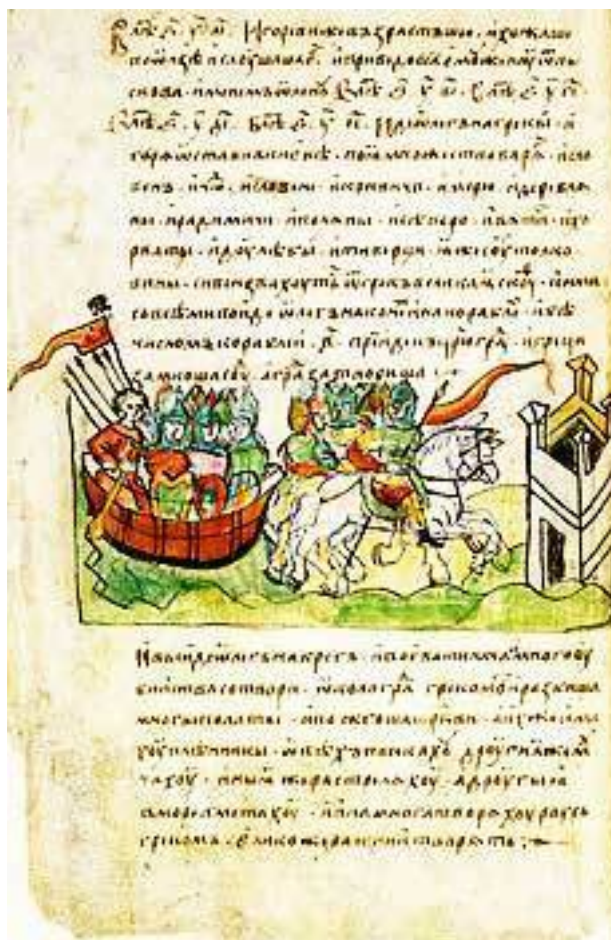
Рис. 1. Вид одной из страниц «Повести»

Академик Б. А. Рыбаков (1908–2001) утверждал, что самые интересные страницы «Повести Временных Лет» были изъяты и заменены . В частности, речь шла о подмене подлинных листов на тексты о призвании варягов.