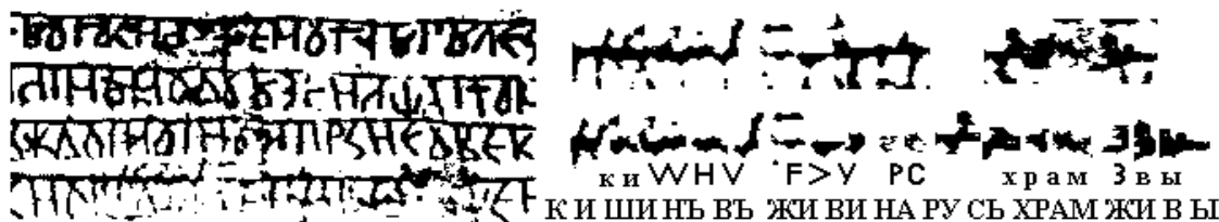
Рис. 4. Экслибрис храма Живы в Кишиневе и его чтение

Дальнейшие поиски привели к тому, что Чудинов, к своему удилению, обнаружил и третий штемпель-экслибрис . Правда, в отличие от таких крупных и по-своему красивых, какими были первые два, этот оказался скромнее и написанным от руки. Он выделялся тем, что был написан над строкой – это правая часть самой нижней, десятой строчки. Еще одним местом хранения дощечек был храм Живы.