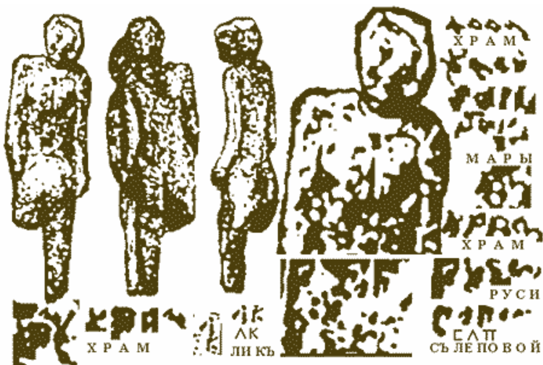
Рис. 5. Три вида фигурки из Нампы и чтение надписей