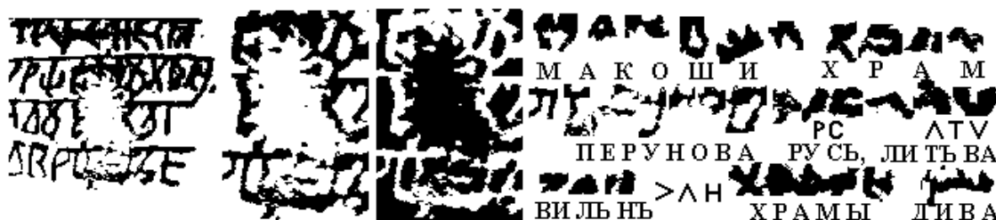
Рис. 3. Экслибрис храма Макоши в Вильно и его чтение

Опять-таки, если это был фальсификатор XVIII–XIX веков, который знал, что древние летописи уцелели прежде всего в Новгороде (кстати сказать, все нынешние исследователи полагают, что Велесова книга создана жрецами из Новгорода), то он, сочиняя штамп храма, поставил бы там в качестве места хранения Новгород, а не Владимир. Возможному фальсификатору вполне достаточно было изготовить один экслибрис . Между тем В. А. Чудинов обнаружил на той же дощечке и второй .