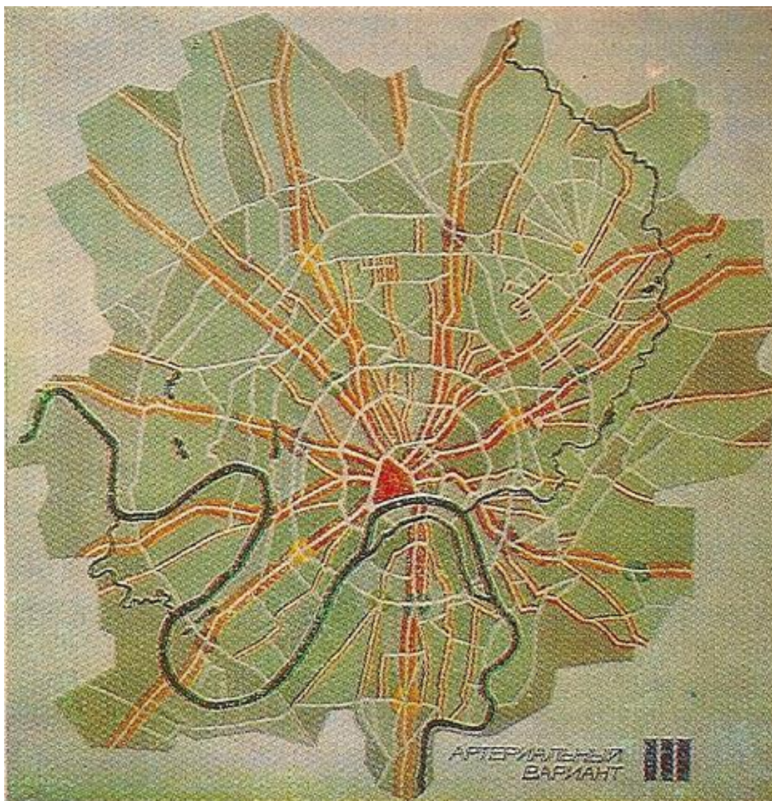
Проекты плановой наружной окраски Москвы 1929 года. Художник П. Антокольский. Реконструкция А. Ефимова, 1976.

I – поясной вариант. II – районный вариант. III – артериальный вариант 4