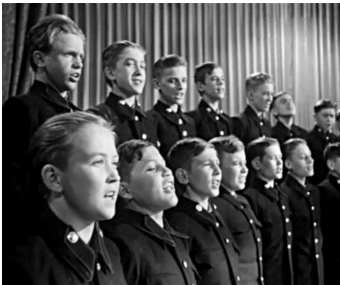
Кадр из фильма «Счастливая юность»