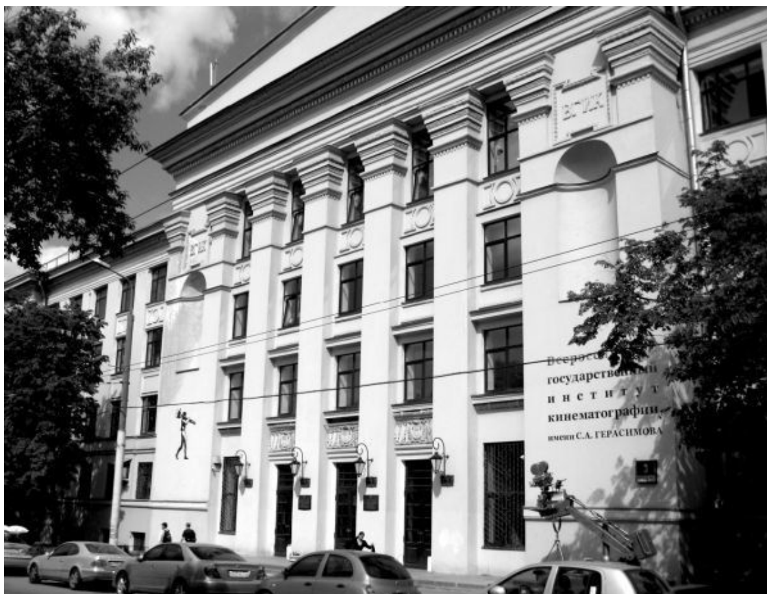
Всероссийский государственный университет кинематографии имени С. А. Герасимова (ВГИК)

Рязанов пришел в кинохронику в 1950 году. Документальное кино тех лет, если говорить о реальной жизни, не имело к ней никакого отношения. Все преподносилось как процветание страны победившего пролетариата. Документальные фильмы, отвечавшие критериям тоталитарного государства, живописно показывающие процветающие союзные республики или парады физкультурников, часто получали Сталинские премии, и за такие заказы между режиссерами шла постоянная борьба.