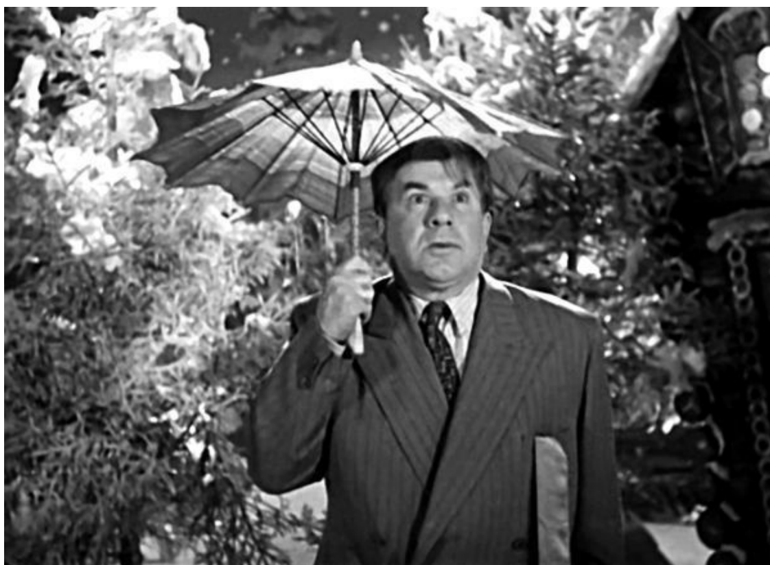
Кадр из фильма «Карнавальная ночь». 1956 г.

По сюжету «Карнавальной ночи» работники Дома культуры готовятся к ежегодному мероприятию – костюмированному новогоднему карнавалу. Развлекательная программа включает в себя сольные, танцевальные, цирковые номера, выступление джазового оркестра, выступления фокусника и клоунов. Товарищ Огурцов, назначенный исполняющим обязанности директора ДК, ознакомившись с программой, не одобряет ее, поскольку, как он считает, все должно быть проведено на высоком уровне и «главное – серьезно!». Он предлагает свою программу, с докладчиком и выступлением лектора-астронома. Кроме классической музыки и выступления ансамбля песни и пляски, никаких других музыкальных номеров, по мнению Огурцова, быть не должно.