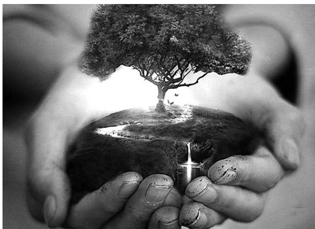
Древо рода – прошлое, настоящее и будущее

Но род – это не только известные тебе родичи, ваши дети и внуки. Это еще и предки твои далекие, и потомки пока не родившиеся. Это и те, кого ты знаешь, и те, о ком и не слышала никогда. Род – это не только люди, не только их биологические тела. Это еще желания и надежды, достижения и неудачи, успехи и поражения. Это знания и стремления, муки и любовь. И все-все, что имеет отношение к семье, кто-то должен держать в своих руках.