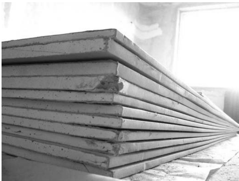
Рис. 1.1. Гипсокартон

На рынке представлен гипсокартон разных производителей (рис. 1.1). При выборе материала необходимо руководствоваться технологическими аспектами покупки, целями, стоящими перед нами, а также принципом «цена – качество».