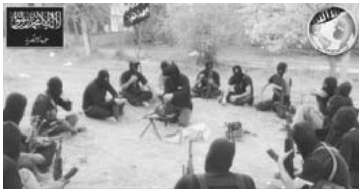
Тренировочный лагерь организации Джабат аль-Нусра в Сирии

Именно эти лагеря стали одной из баз подготовки и заброски боевиков на территорию Сирии в ходе активных боевых действий 2012 года. При этом в лагеря свозилось и продолжает свозиться оружие, техника и боеприпасы со складов ливийской армии. В этом же направлении исчезли более 10 тысяч ПЗРК, возможно, именно там хранится несколько тонн похищенного в самом начале ливийского мятежа отравляющего вещества зарина.