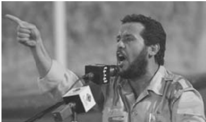
Абдель Хахим Бельхадж (Ливия)