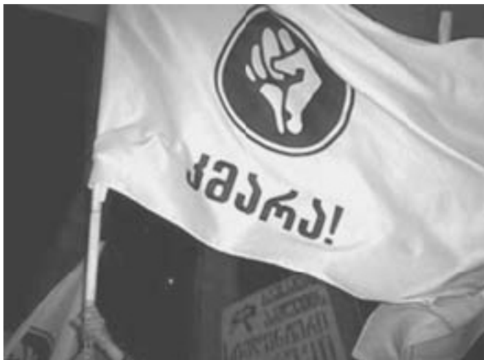
Флаг грузинского движения «Кмара»