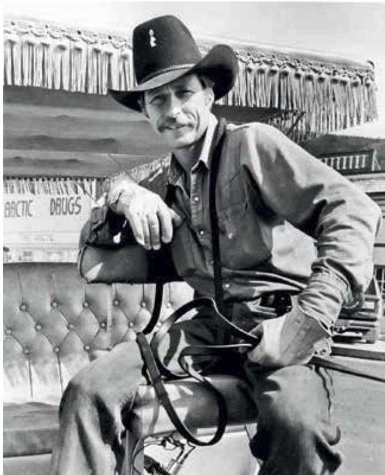
Герой опереточного города – «ковбой».