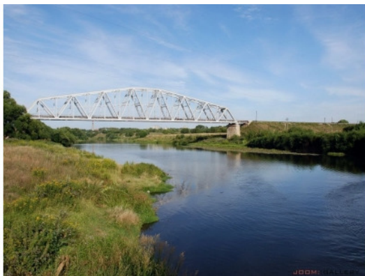
Рис.1. Река Дон у железнодорожного моста.

здателям сайтов, «раскопавшим» историю города. Я использую эти сайты в своих воспоминаниях для описания Данкова, так как без привязки к месту многие события будут непонятны для читателя.