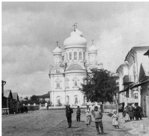
Рис.2. Тихвинский собор в центре г. Данкова. Снимок до революции 1917 г.

новится малым центром православия. В центре города возвышается большой 2-х этажный Тихвинский Собор, основанный в 1861 г., с высокой колокольной-звонницей. При слиянии рек был образован мужской Покровский монастырь, построены Духовное училище, гимназия, больница, городской сад с кинотеатром, тюрьма, почта, телеграф, хорошая городская библиотека, собранная из фондов бывших купцов и дворян.