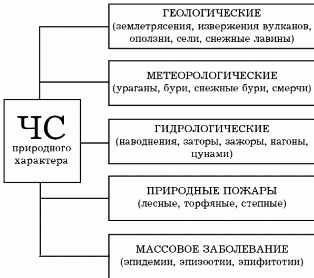
Рис. 1. Классификация ЧС природного характера