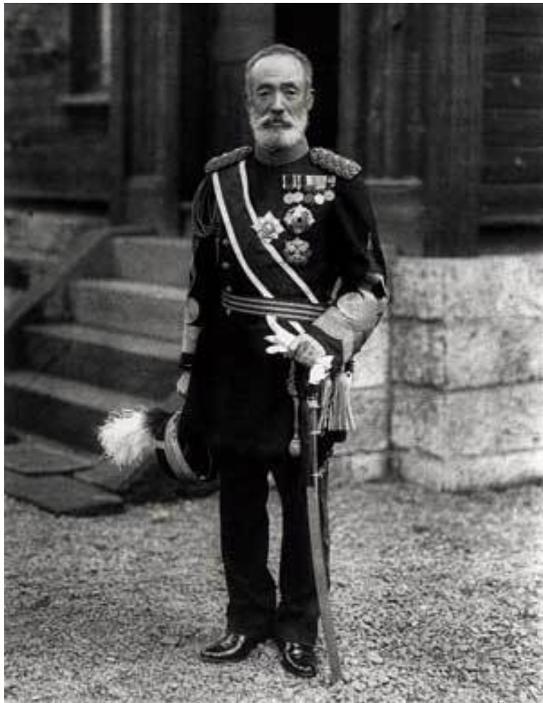
Японский генерал. Во время японо-китайской войны