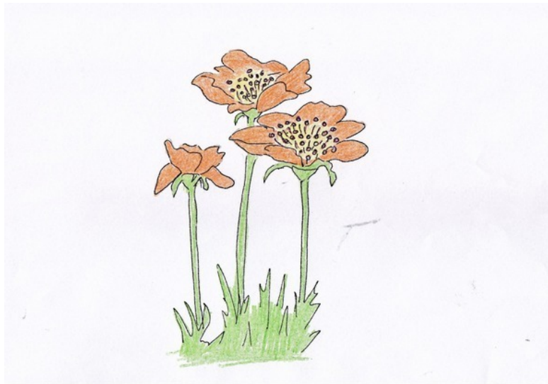
Рис. А. Дубровиной

Волшебный Лес готовился встретить новых гостей, вернее, новых учеников. Он с любовью подбирал для них «учителей», которые пока и сами-то не подозревали, что будут кого-то учить. Их встреча произойдёт «случайно», как всегда.