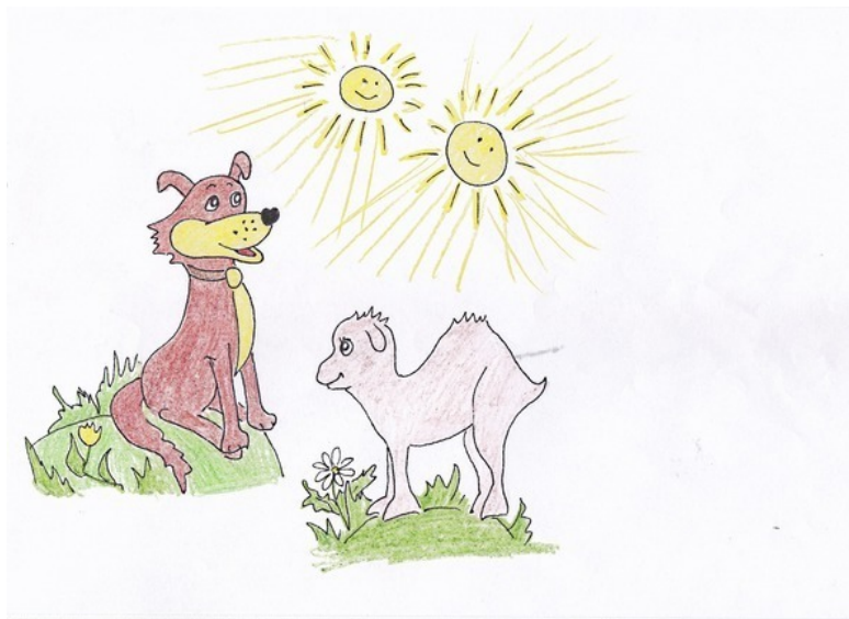
Пёс Бак и Верблюжонок Ликки. Рис. А. Дубровиной

тельное Путешествие, ради которого их позвал Волшебный Лес. Скоро они начнут появляться на Поляне.