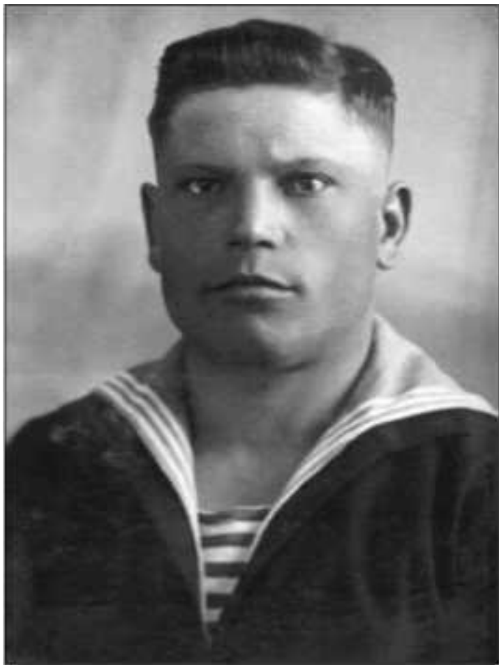
Автомеханик 12-й КОИАЭ