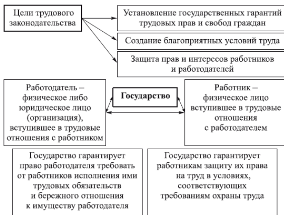
Рис. 1.5. Цели и задачи трудового законодательства в области ОТ

Реализация государственной политики в области ОТ осуществляется через взаимосвязанный комплекс нормативно-правовых актов по различным разделам деятельности.