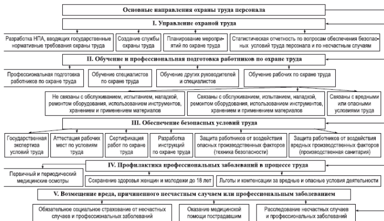
Рис. 1.4. Основные направления ОТ персонала