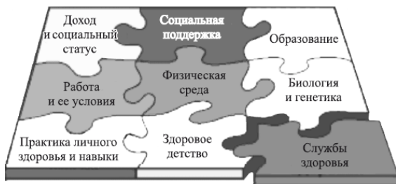
Рис. 1.2. Факторы, определяющие здоровье населения

Факторы, определяющие здоровье населения, представлены на рис. 1.2.