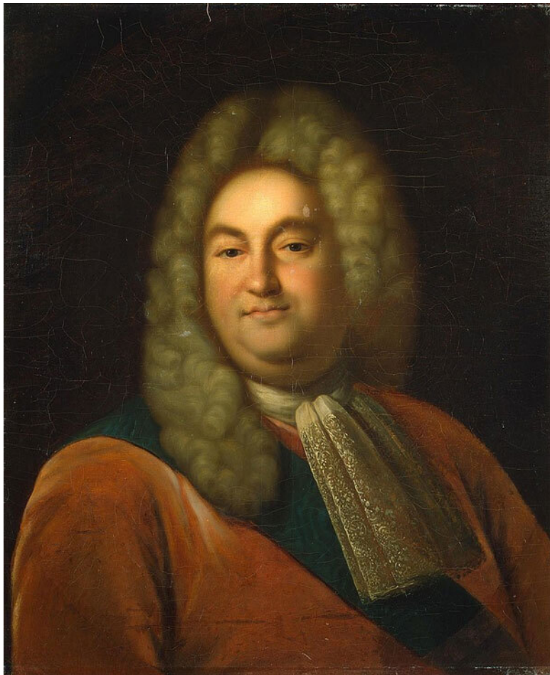
Вице-канцлер барон Петр Павлович Шафиров