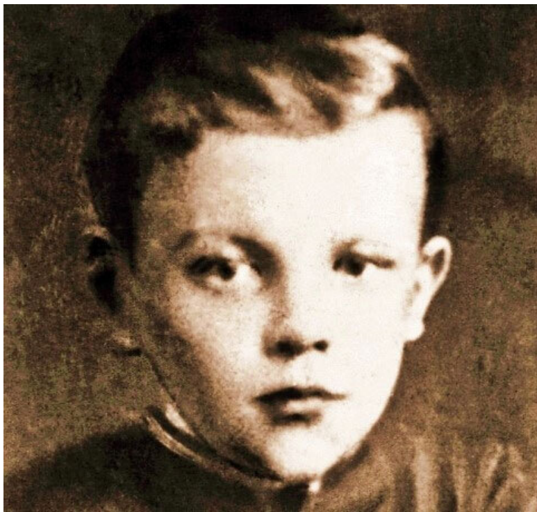
Володя Ульянов – мальчик с кудрявой головой

Началось создание новой квазирелигии еще в 1923 году. Ленин был еще жив, поэтому особенно не усердствовали, наиболее нетерпеливых даже одергивали. Старательно работали по лекалам Гражданской войны: мудрый вождь пролетариев ведет рабочих и крестьян Советской России к победе и счастью. Но все изменилось со смертью Владимира