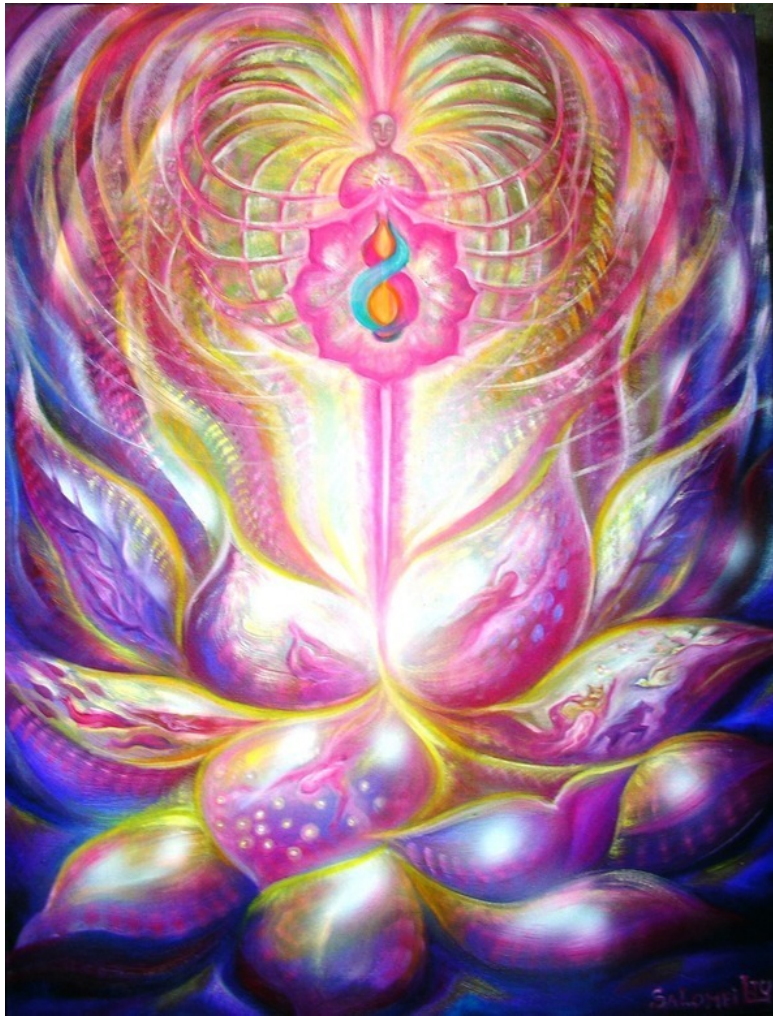
Эзотерическая картина Юлии Лагус