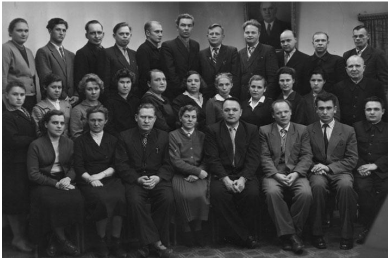
Серов. Аппарат горкома партии и горисполкома. 1960 г.