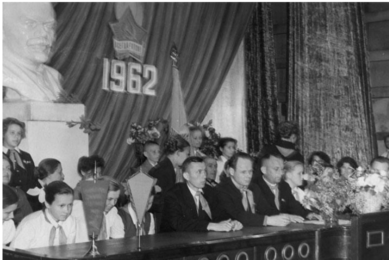
Серов. На слете пионеров. 1962 г.