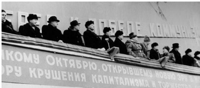
Серов. Дворец культуры металлургов во время праздничной демонстрации. Октябрь 1959 г.