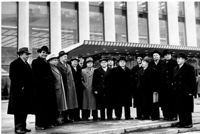
Делегаты XXII съезда КПСС от Свердловской областной партийной организации. Москва, Кремлевский Дворец съездов. 1961 г.