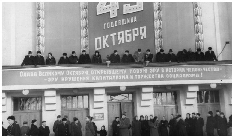
Серов. 43-я годовщина Октября. Трибуна.