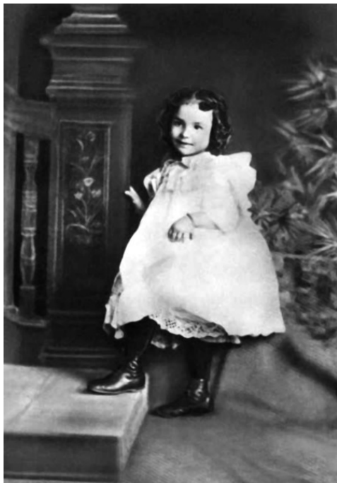
Айседора Дункан. 1880 г.

ников и их родителей не мог определить истинный возраст юной учительницы танцев. Когда же мисс Дункан начинала торговаться, ее глаза приобретали фиолетовый оттенок моря в бурю и метали молнии, а рыжие ирландские волосы горели, словно маленький факел, – кто бы мог подумать, что так смеет вести себя тринадцатилетняя девочка?!