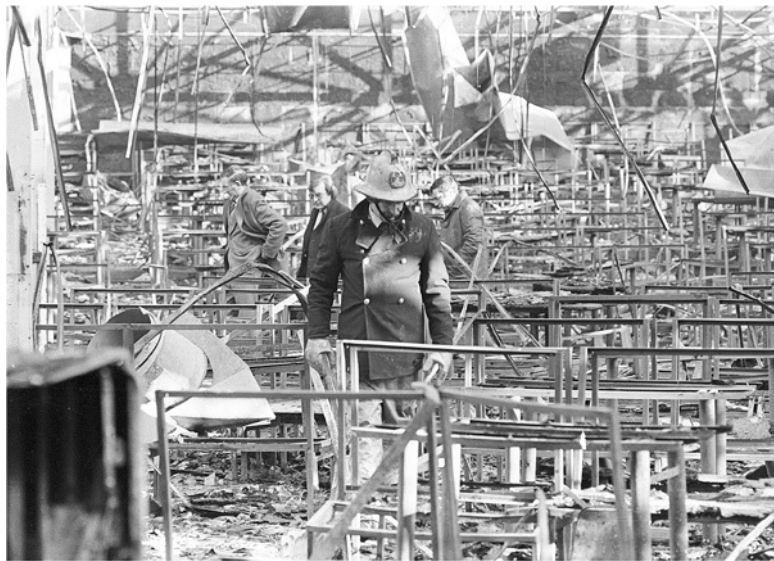
Следователи на месте пожара в дискотеке Stardust, в ходе которого 48 человек погибли и более 240 получили травмы

Да, совсем по-другому надеялись запомнить праздничную ночь гости дискотеки. Мальчики и девочки не старше 20 заплатили по три фунта за билет, дававший им право на сосиску с чипсами и танцы до двух ночи. Их было 841.