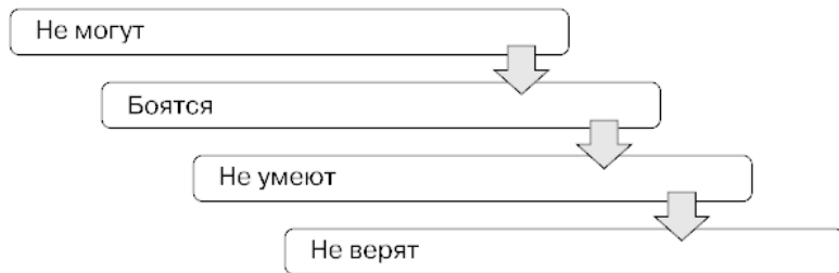
Рис. 1.1. Причины, по которым звонящий испытывает препятствия в совершении звонка

Когда я поговорил с коллегами и получил их мнение об отказе сделать первый звонок потенциальному партнеру, мне пришла в голову одна несложная схема (рис. 1.1).