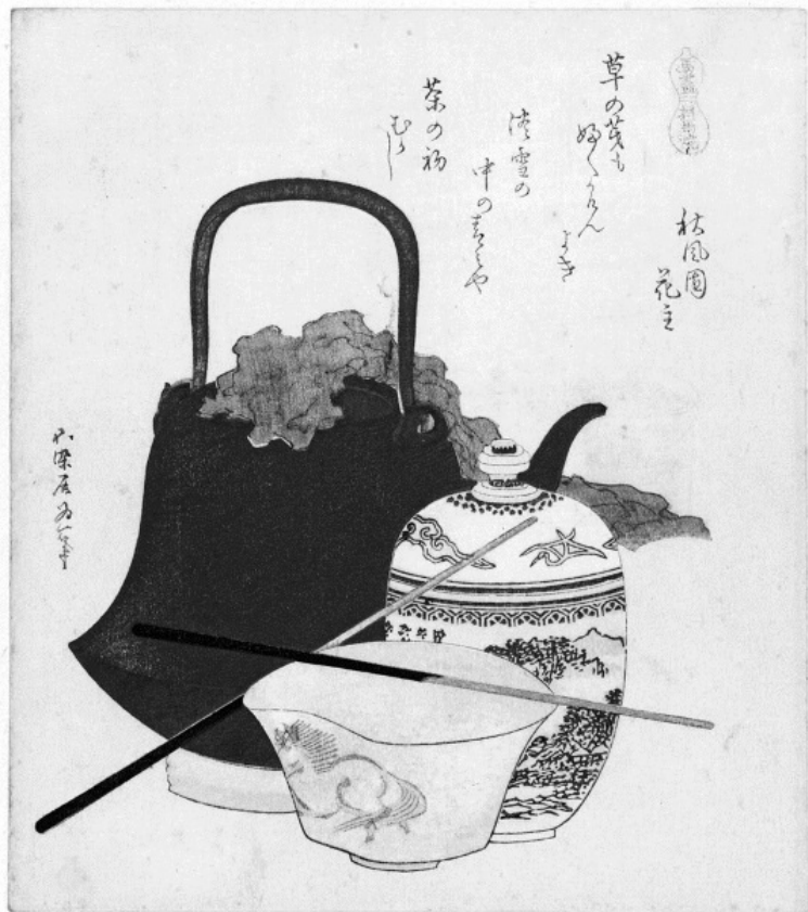
Кацусико Хокусай. Натюрморт.

Они должны надежно укрывать от дождя, и притом следует тратить как можно меньше времени на ремонт и обнов-