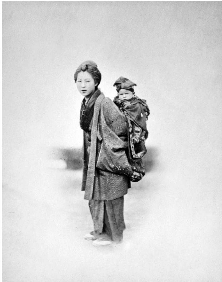
Мать с ребенком на спине. Фото. 1877.