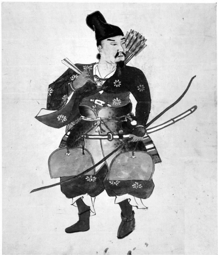
3. Автор неизвестен. Воин-лучник. XIX в.

Такая ошибка проистекает из поверхностного изучения предмета, поэтому начинающие не должны довольствоваться-