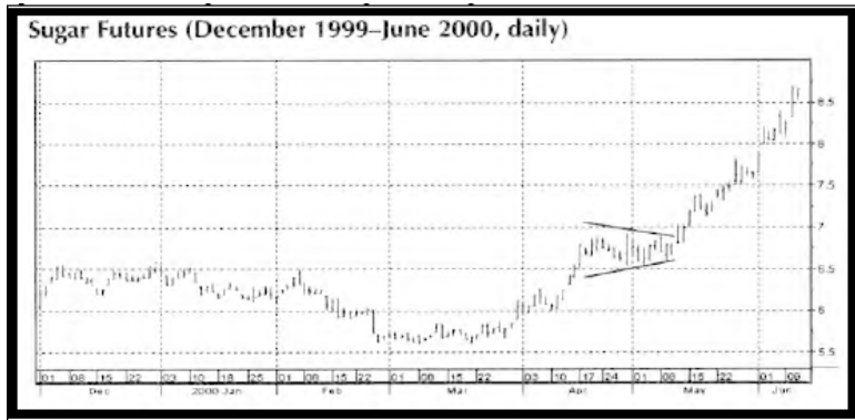
Рис. 2 Фьючерсы на сахар, ежедневно

Модели продолжения включают в себя треугольники, малые прямоугольники, вымпелы и флаги. Обычно они формируются в силу того, что предыдущее движение было слишком быстрым. Агрессивные свинг-трейдеры понимают, что модели продолжения являются одним из лучших методов выявления предпосылок к сделкам с наиболее предпочтительным отношением риск/доходность. Чем больше времени трейдер проводит в рынке, тем большему рыночному риску он себя подвергает. Задачей торговли на краткосрочных рыночных свингах является попытка вырвать большую часть прибыли за меньшее время. Для примера, на Рис. 2 приведена модель продолжения в виде так называемого "бычьего флага". Предшествующее движение вверх было таким сильным, что оно сформировало "древко" флага.