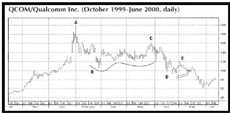
Рис. 3 Последовательность Вайкоффа, QCOM, ежедневно

Следующим происходит "автоматическое ралли" (automatic rally), относящееся, в основном, к закрытию коротких позиций. В общем случае, объем при этом повышении незначителен. Никто из крупных участников рынка или институционалов еще не открывает значительных длинных позиций. За автоматическим ралли следует "вторичный тест" (secondary test). Это повторное тестирование минимального уровня кульминации продаж. Обычно, рынок делает более высокий минимум во время этого вторичного теста. После прохождения вторичного теста, устанавливается торговый диапазон, который может длиться достаточное время. Рынок, в конце концов, покажет, что он готов вырваться из этого торгового диапазона, демонстрируя "знак силы" (sign