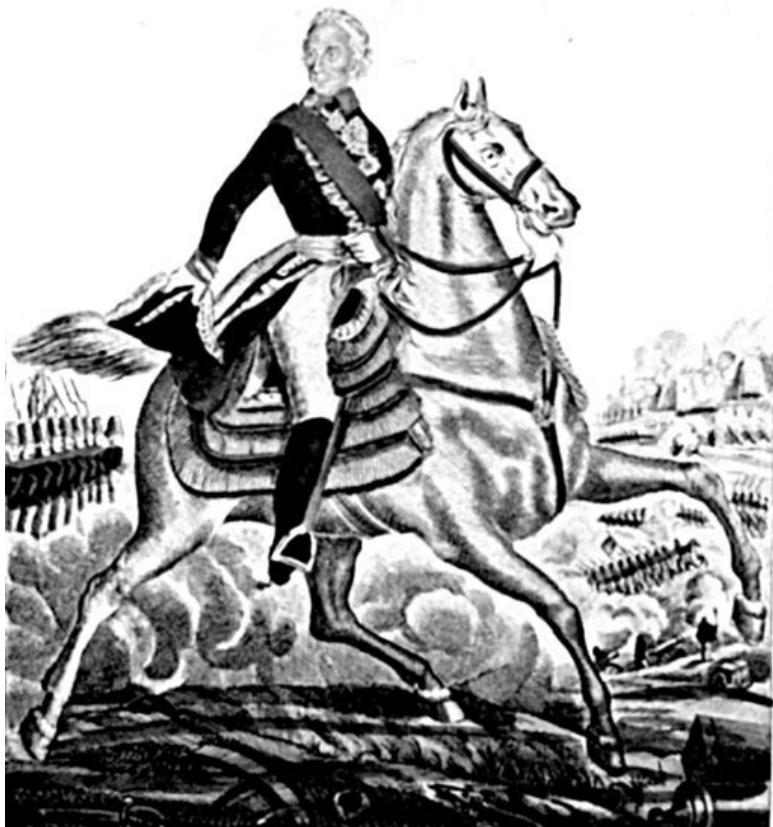
Лубочный образ А.В. Суворова

Здесь в ходе Семилетней войны начинает складывать-