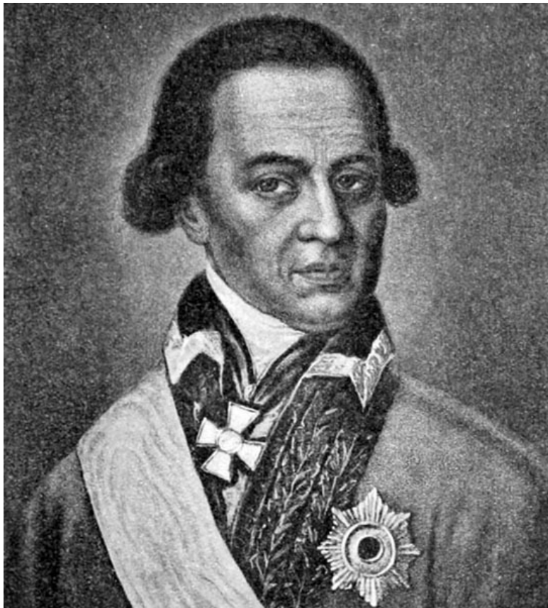
Абрам Петрович Ганнибал