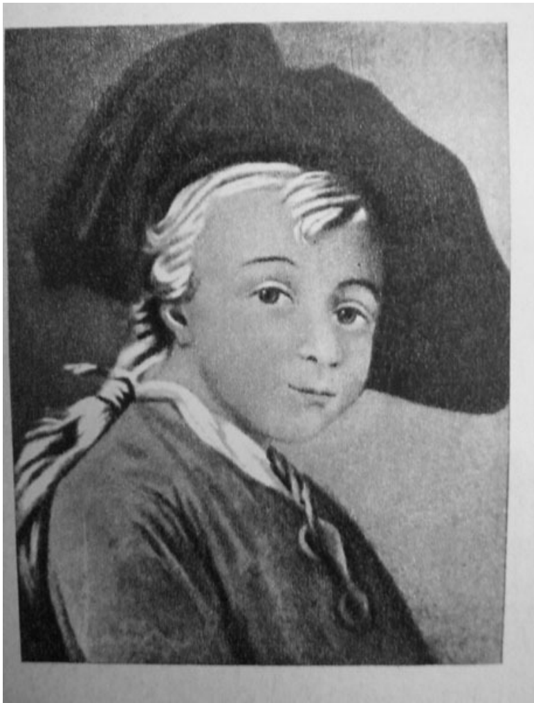
Портрет А.В. Суворова в детстве. Неизвестный художник