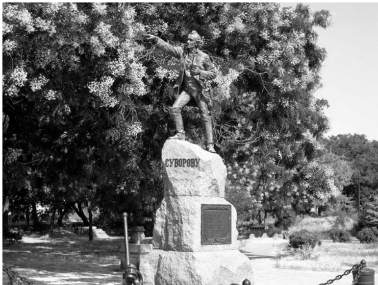
Памятник А.В. Суворову, г. Очаков (Украина)

в бою и с хваленой прусской системой, на опыте познав ее достоинства и недостатки.