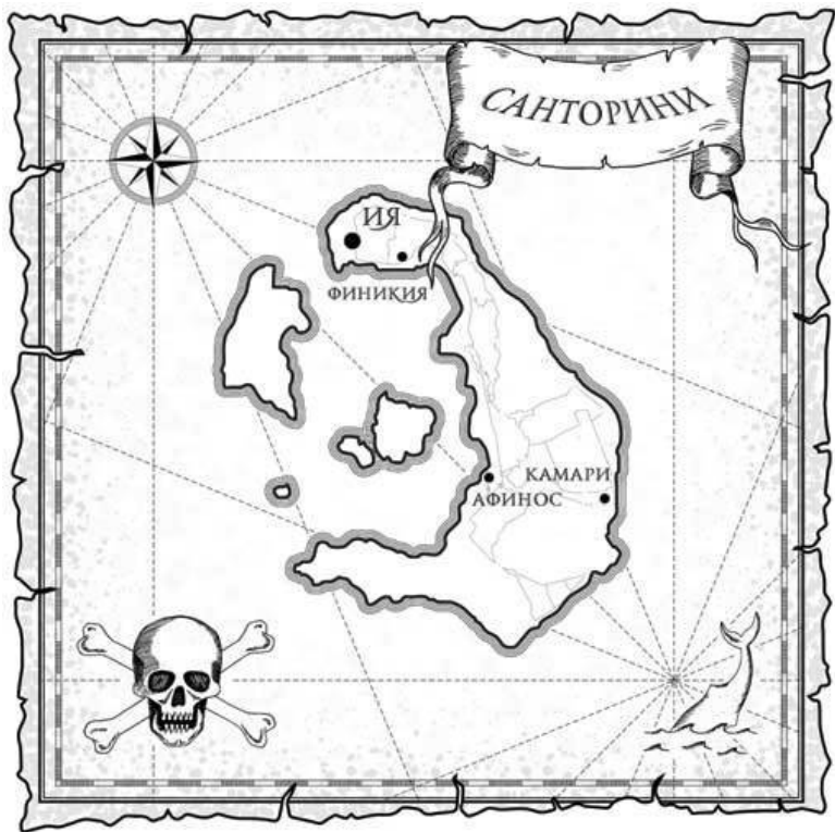
Карта греческого острова Санторини

Считается, что еще более раннее извержение вулкана на Санторини могло уничтожить и Атлантиду, которая находилась где-то в районе архипелага. И хотя существование этой легендарной земли учеными пока не доказано, археологи находят немало артефактов, которые свидетельствуют,