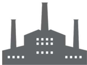
Источник стоимости в прошлом

полнения работы требуется огромная скорость принятия решений. Большинство же, как целеустремленные и трудолюбивые люди, пытаются подходить к решению этой проблемы линейно. Они принимают решения по мере поступления, по одному за раз, настолько хорошо и быстро, насколько возможно, а потом переходят к следующему, как на конвейере.