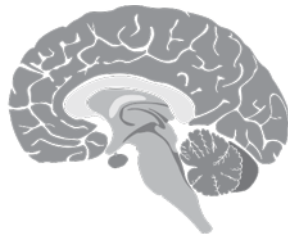
Источник стоимости в настоящем

Дело, однако, в том, что невозможно предвидеть, когда придется принимать важные решения, а потребность в их принятии возникает нелинейно. Если не учитывать этого, то можно упустить важные моменты из виду или не уделить им должного внимания. Линейный подход ведет к неудаче в нелинейном мире. Упорная работа и простое увеличение ее скорости не приводит к значительному росту эффективности в мире, где стоимость создается путем осмысления картины в целом, расстановки приоритетов и принятия взвешенных решений в отношении тех аспектов, которые по-на-