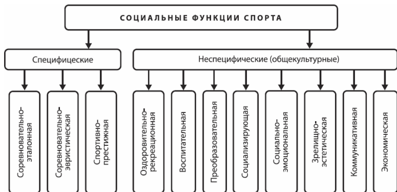
Рис. 1.2. Социальные функции спорта