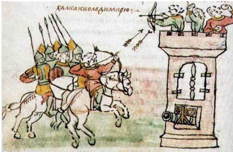
Русское войско. Миниатюра Радзивилловской летописи

К середине XII в. четко выделяются несколько самостоятельных княжеств, претендующих на роль независимых государств: Киевское, Черниговское, Полоцкое, Переяславское, Ростово-Суздальское и Галицко-Волынское. Кроме того, в Древней Руси всегда особняком стояла Новгородская земля. Ее жители сами выбирали себе князя.