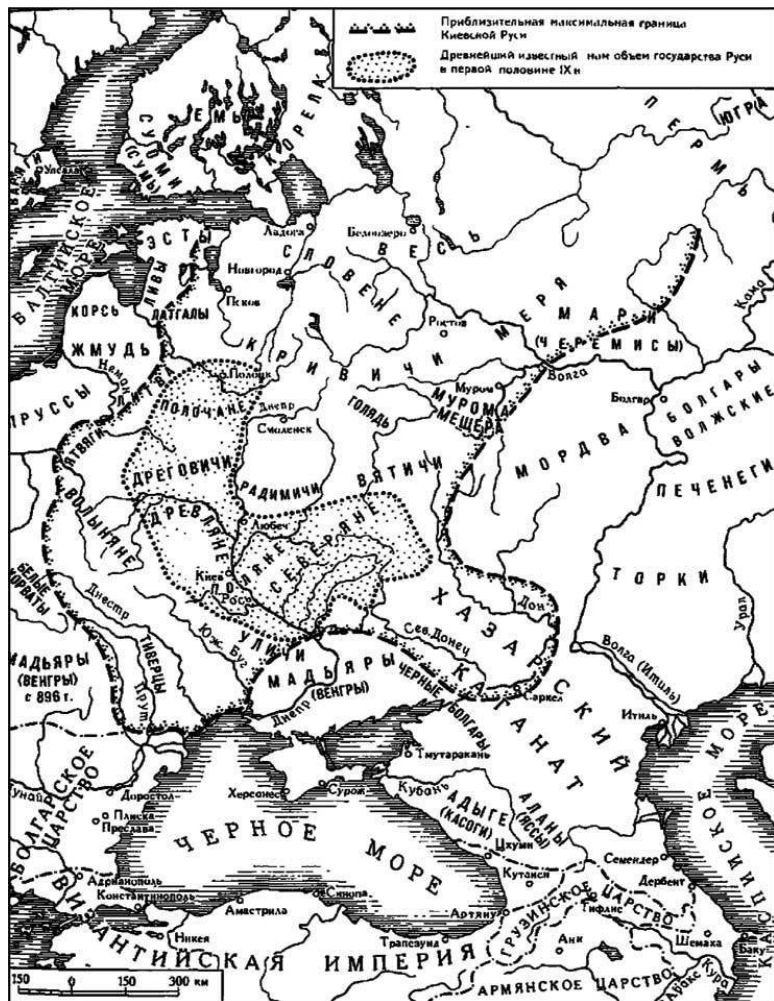
Русь в X в. Схема