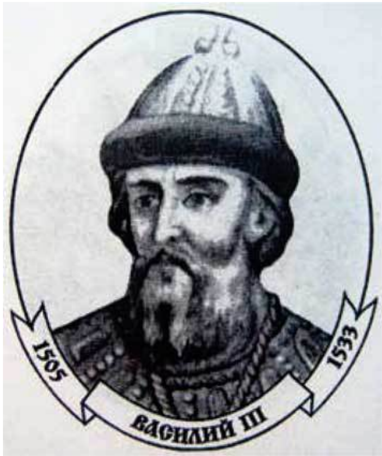
Портрет великого князя московского Василия III, отца Ивана Грозного