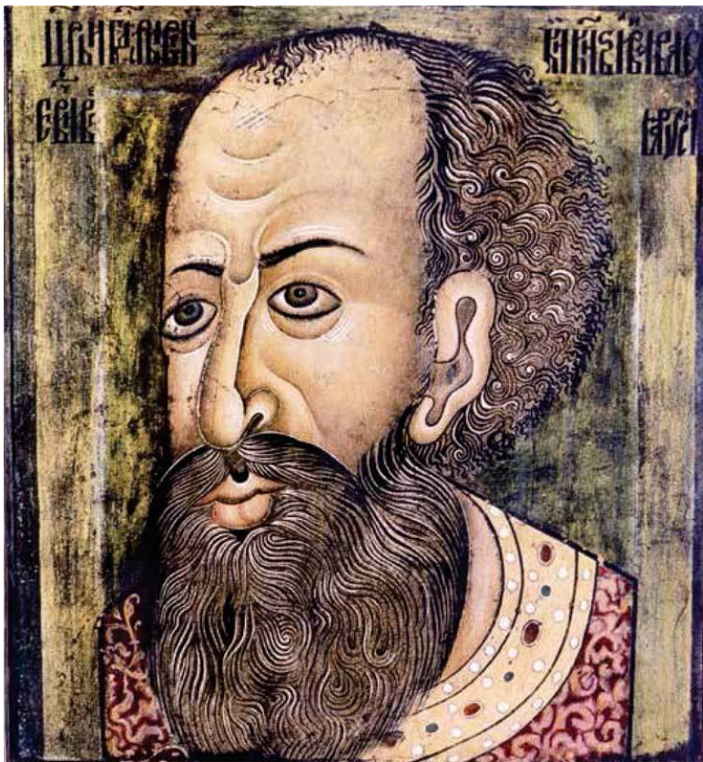
«Копенгагенский портрет» Ивана Грозного, XVI век

Персона царя Ивана Васильевича вызывала пристальный интерес потомков давно.