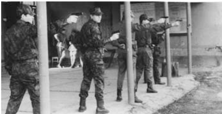
Надёжный «Макарыч» (ПМ) в руках опера только на