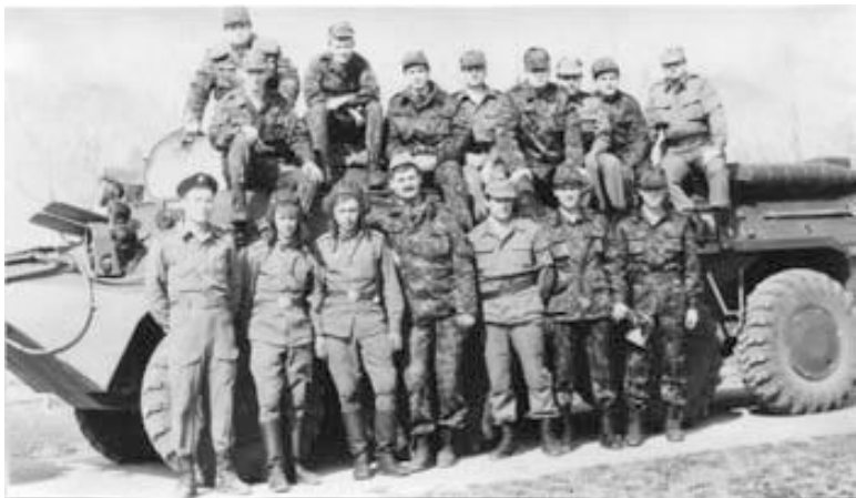
Оперативники отдела на практическом вождении БТР (полигон ОМСДОН)