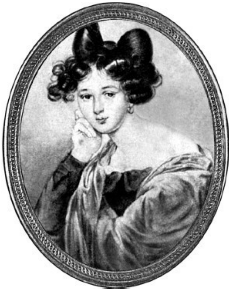
Эл. Ф. Тютчева.