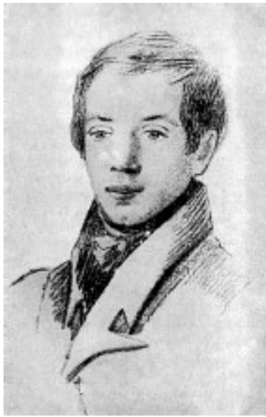
М. П. Погодин.

Рисунок неизвестного художника. Москва, 1820-е годы.