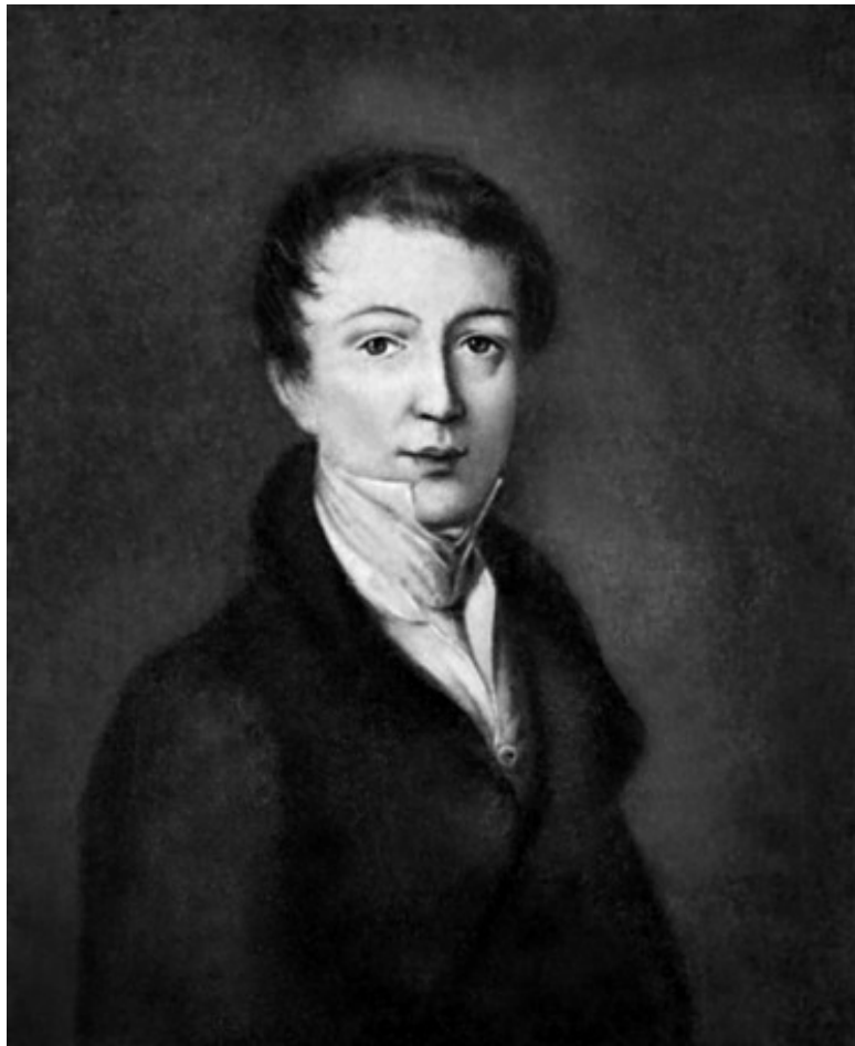
Ф. И. Тютчев.