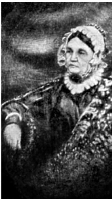
И. Н. и Е. Л. Тютчевы, родители поэта.