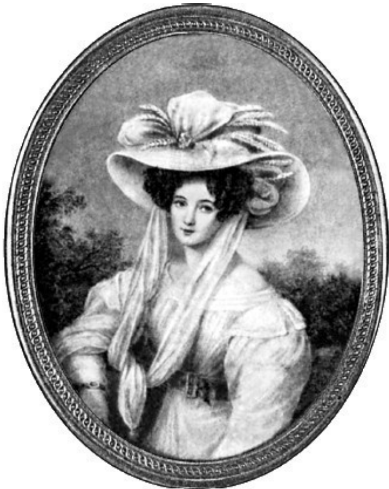
Эл. Тютчева, первая жена поэта.