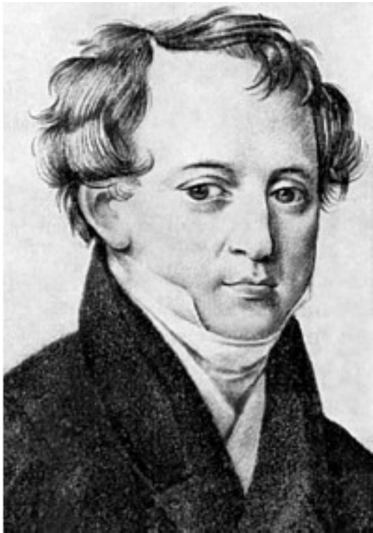
Н. И. Тютчев.

Портрет работы неизвестного художника. <Москва, сентябрь – ноябрь 1825 г.>