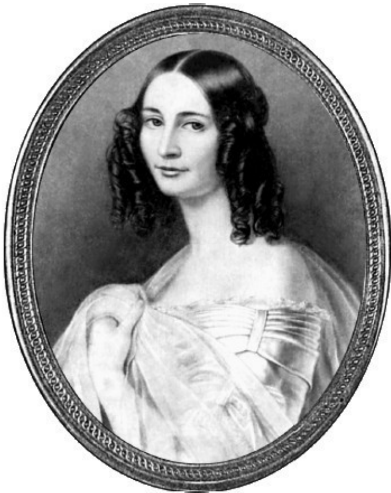
Эрн. Ф. Тютчева, вторая жена поэта.