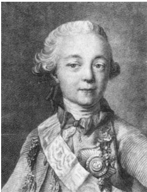
Цесаревич Павел. 1765 г.