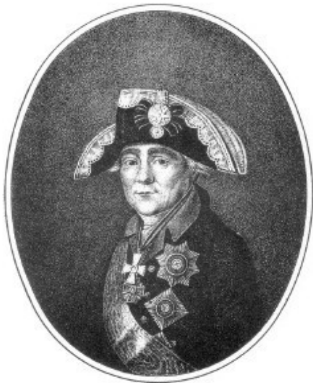
М. Ф. Каменский

шал, участник Семилетней войны, причем прошедший кампании 1758 и 1759 гг. волонтером во французской армии, человек, храбрость которого сделала его известным лично Фридриху Великому 49 .