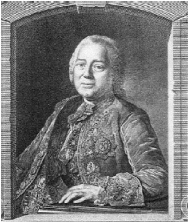
Н. И. Панин

Значительную роль в увлечении Павла армией сыграли и некоторые из военных деятелей екатерининской эпохи, близко общавшиеся с Цесаревичем, прежде всего родной