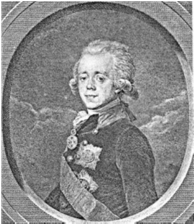
Павел I. 1798–1800 гг.

Именно в гатчинской пехоте постигали азы военной науки старшие сыновья Павла – Великие Князья Александр и Константин. В 1796 г. Александр был назначен шефом 2-го батальона, а Константин – 3-го 3 .