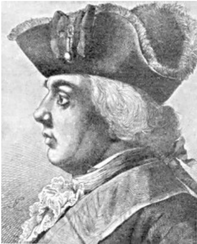
Фридрих Вильгельм I

В своем понимании образа мыслей и наследия Фридриха II Павел стал совершать шаги, которых „Старый Фриц“ не сделал бы никогда» 58 . Кстати, нужно отметить, что во мно-