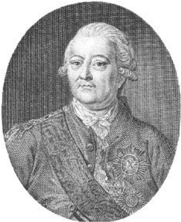
П. И. Панин

Еще одним желанным собеседником, прошедшим не одно сражение, был для молодого Павла полковник Михаил Федотович Каменский (1738–1809), будущий Генерал-Фельдмар-