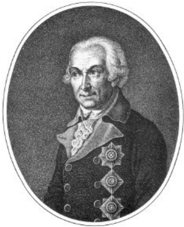
Н. В. Репнин

Еще в 1769 г. возникает длившаяся много лет переписка между Павлом и П. И. Паниным 66 . Вторую редакцию «Рассуждения», переработанного в 1778 г., Павел с пись-