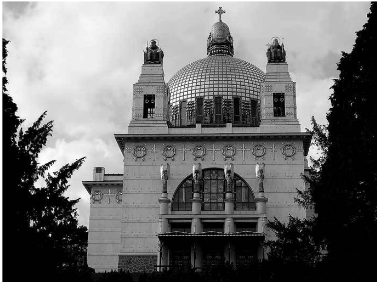
Храм им. Св. Леопольда, арх. Отто Вагнер