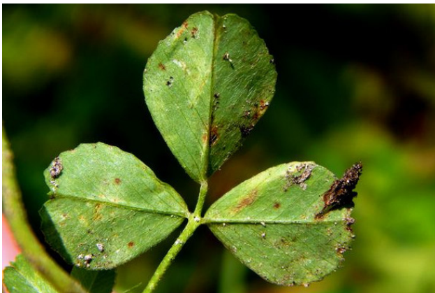
Листовая пластинка снизу