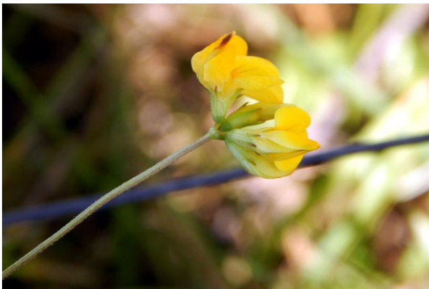
Соцветие лядвенца – пятицветковый зонтик