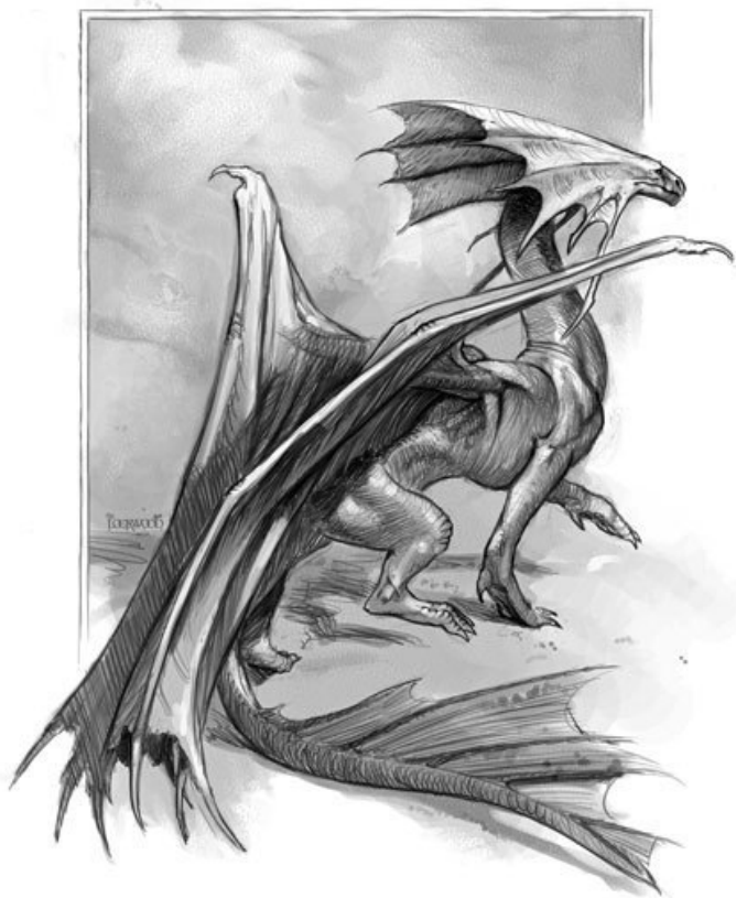
Ахиатский пустынный дракон