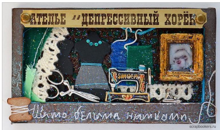
АТЕЛЬЕ «ДЕПРЕССИВНЫЙ ХОРЕК»

К верхнему краю визитки прикреплена жестяная табличка, на которой шрифтом, типичным для печатных машинок, выбито: