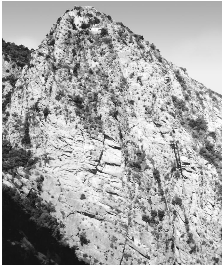
Пещера при. Нила Мироточивого