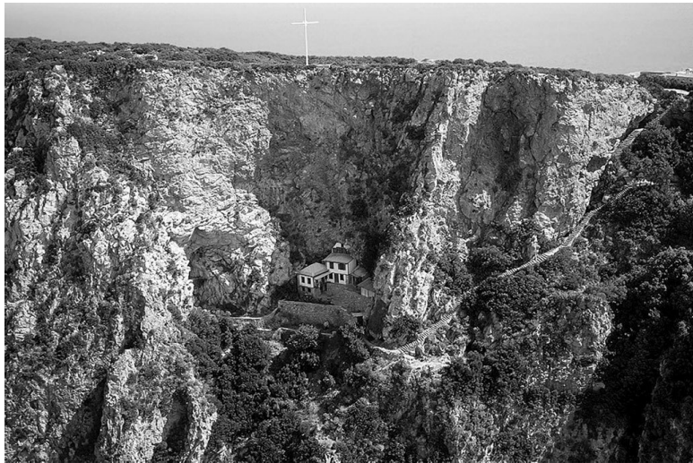
Пещера прп. Афанасия Афонского