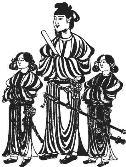
Сётоку Тайси. Со старинной гравюры

Окусэ Хэйситиро приводит иную версию. Он считает, что таланты Сайдзина проявились не на войне, а во время мира. И был он шпионом не военным, а политическим и полицейским.