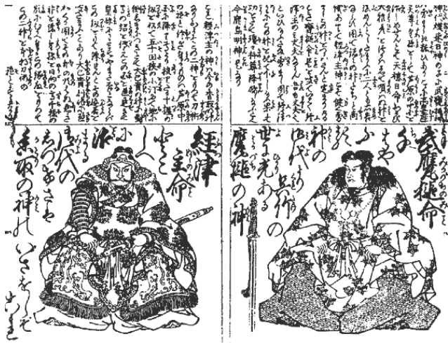
Воинские божества Фуцунуси-но микото (слева) и Такэмикадзуги-но микото (справа). Со старинной гравюры