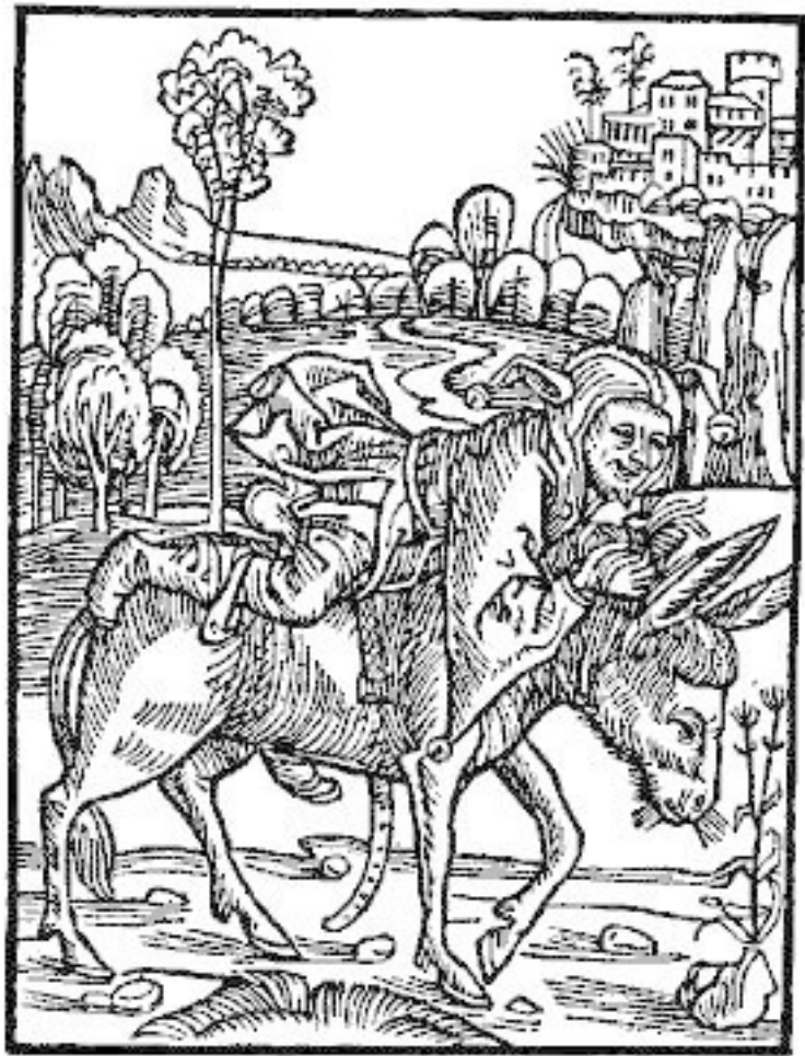
С гравюры Альбрехта Дюрера, конец XV – начало XVI в. Из иллюстраций к «Кораблю дураков» С. Бранта