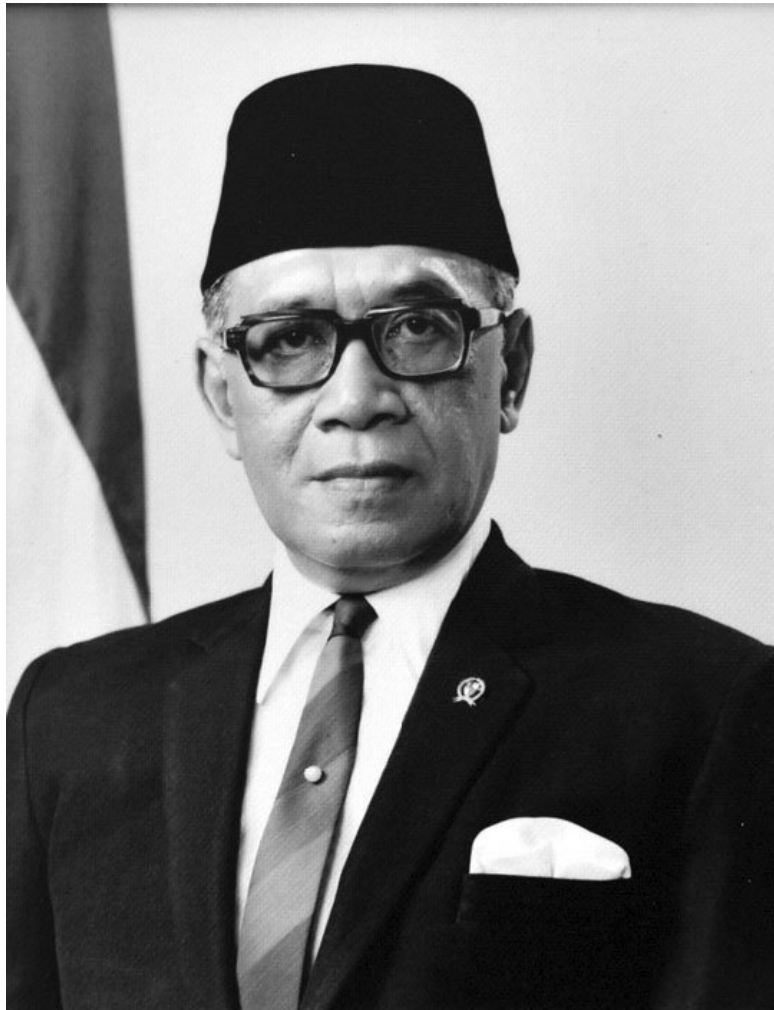
Президент Индонезии Сухарто