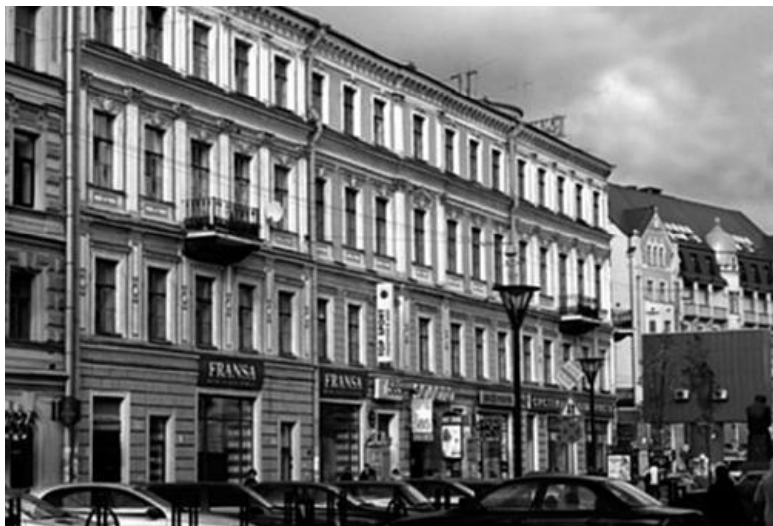
Дом № 1/3

Четвертого декабря 1876 г. на собрании выборных ремесленного сословия было решено для повышения доходности владения взять ссуду в Петербургском городском кредитном обществе, отремонтировать дома и сдать их в аренду.