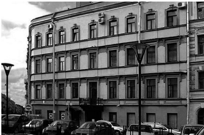
Дом № 5

полы и установлены мраморные подоконников, стены украшены богатой лепниной. Покои владельцев украшала большая медная ванна. Богатая отделка внутри лицевого дома оценена архитектором в 44 тыс., а наружная – в 60 тыс. руб.