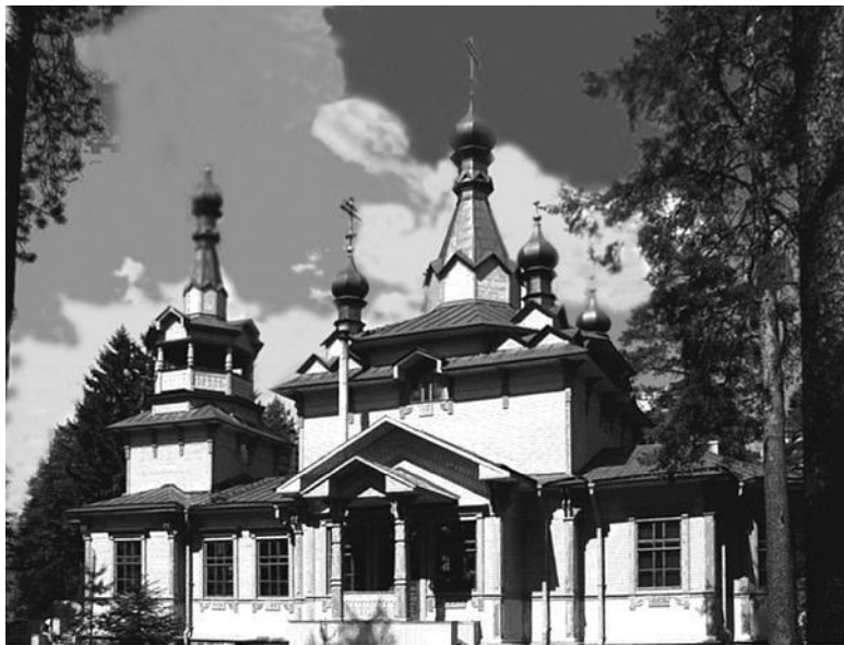
Церковь Преподобного Серафима Саровского. 2006 г.

ждения 13 декабря 1990 г. указом митрополита Ленинградского и Ладожского Иоанна (Снычева).