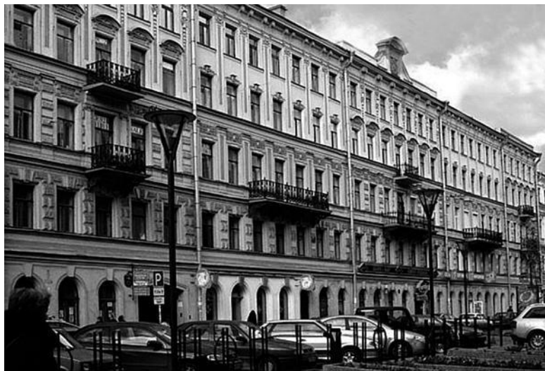
Дом № 3