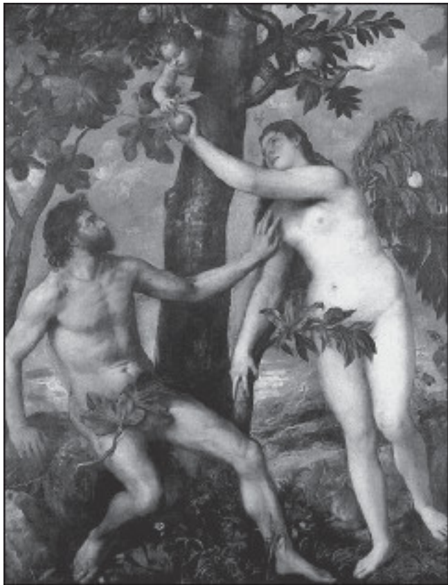
Тициан. Адам и Ева

В четвертый день Бог сказал: «Да будут на небе светила, освещающие землю!» И стало так. Для дня Бог создал солн-