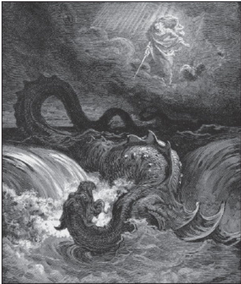
Г. Доре. Убийство Левиафана. 1865 г.