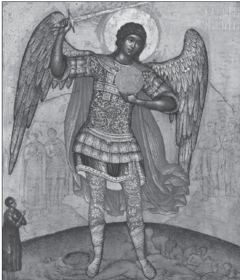
Архангел Михаил, попирающий дьявола. Икона, 1676 г.