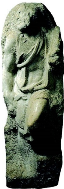
Обломок статуи Будды из храма Ват Махатхат, XIV в. Таиланд.