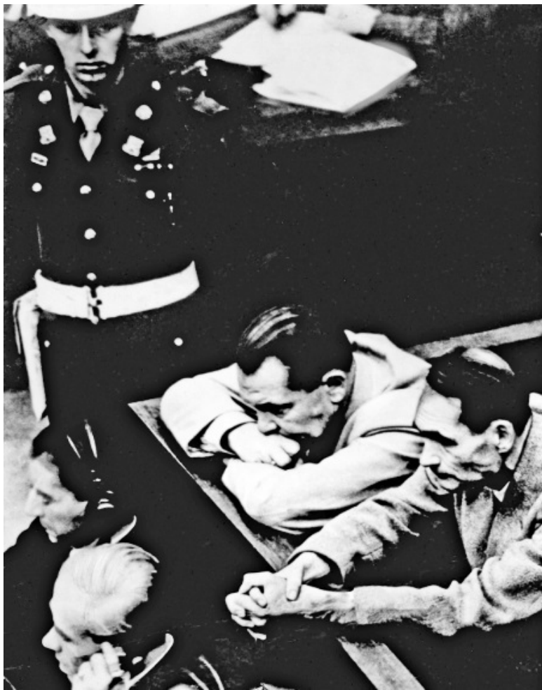
Геринг и Гесс на скамье подсудимых в Нюрнберге