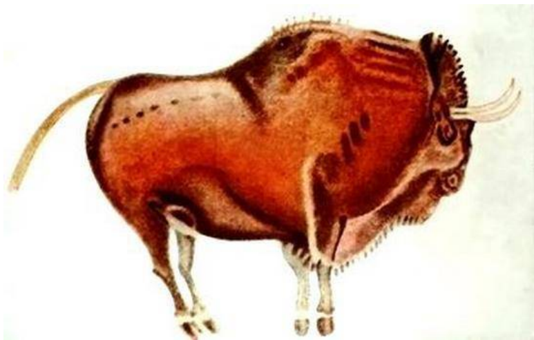
Рис. 2. Пещера рук (Куэва-де-лас-Манос). Аргентина, IX тыс. до н. э. (а); Бык (фрагмент из пещеры Альтамира). Испания, XV–VIII тыс. лет до н. э. (б)

Кроме названных, существуют и другие интересные гипотезы происхождения изобразительного искусства, например, трудовая гипотеза (А.П. Окладников), гипотеза фоссфенов (связывает возникновение искусства с воспроизведением образов, естественно возникающих у человека в темноте при надавливании на глаза, а также с образами галлюцинаций в условиях недостаточной зрительной стимуляции), психофизиологическая гипотеза (искусство как результат межполушарного взаимодействия) и др. В своей совокупности они служат обоснованием фундаментальной связи между ху-